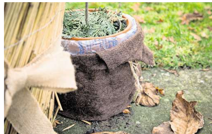
Dick eingepackt: Mit isolierendem Material können Topfpflanzen im Herbst noch draußen stehen bleiben.

Viele Gehölze und Stauden wurzeln am besten, wenn sie