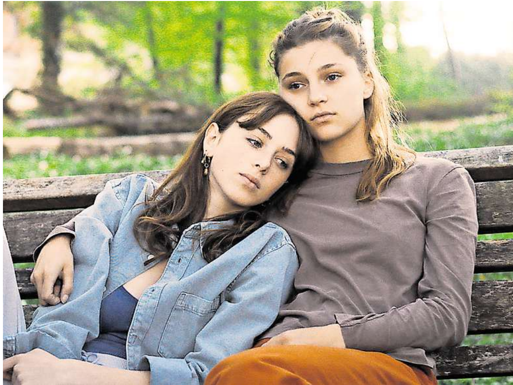
Szene aus „Rivière“.

Spielfilmhighlights sind das knallbunte, intergalaktische Abenteuer „Lesbian Space Princess“ (24. Oktober, 20 Uhr, Englisch mit deutschen Untertiteln) und die Fortsetzung des Publikumsereignisses „Mascarpone“ von 2022 – die schwule Romantikkomödie „Mascarpone 2: The Rainbow Cake“ (31. Oktober, 20 Uhr, Italienisch mit dt. UT). Die Romantik kommt auch in „Lesbian Space Princess“ nicht zu kurz, wenn Prinzessin Saira ihre Freundin Kiki aus den Händen der Straight White Malien befreien muss. In „Mascarpone 2“ treffen wir Luca und den Konditor Antonio wieder und begleiten sie durch die Liebeswirren ihres neuen Lebens.