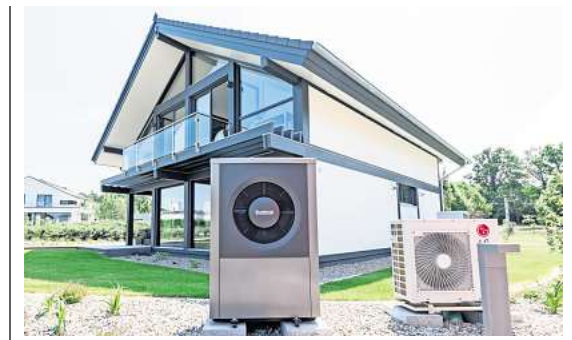
Klimafreundlich: Wärmepumpen gelten als saubere Alternative für die Beheizung von Häusern.

Viele weitere, spannende Neuigkeiten aus der lokalen Kulturszene finden Sie in der aktuellen Ausgabe unseres Partnermediums magaScene, monatlich frisch gedruckt und kostenlos an über 500 Auslegestellen in Hannover oder online auf www.magaScene.de inklusive Download-Möglichkeit.