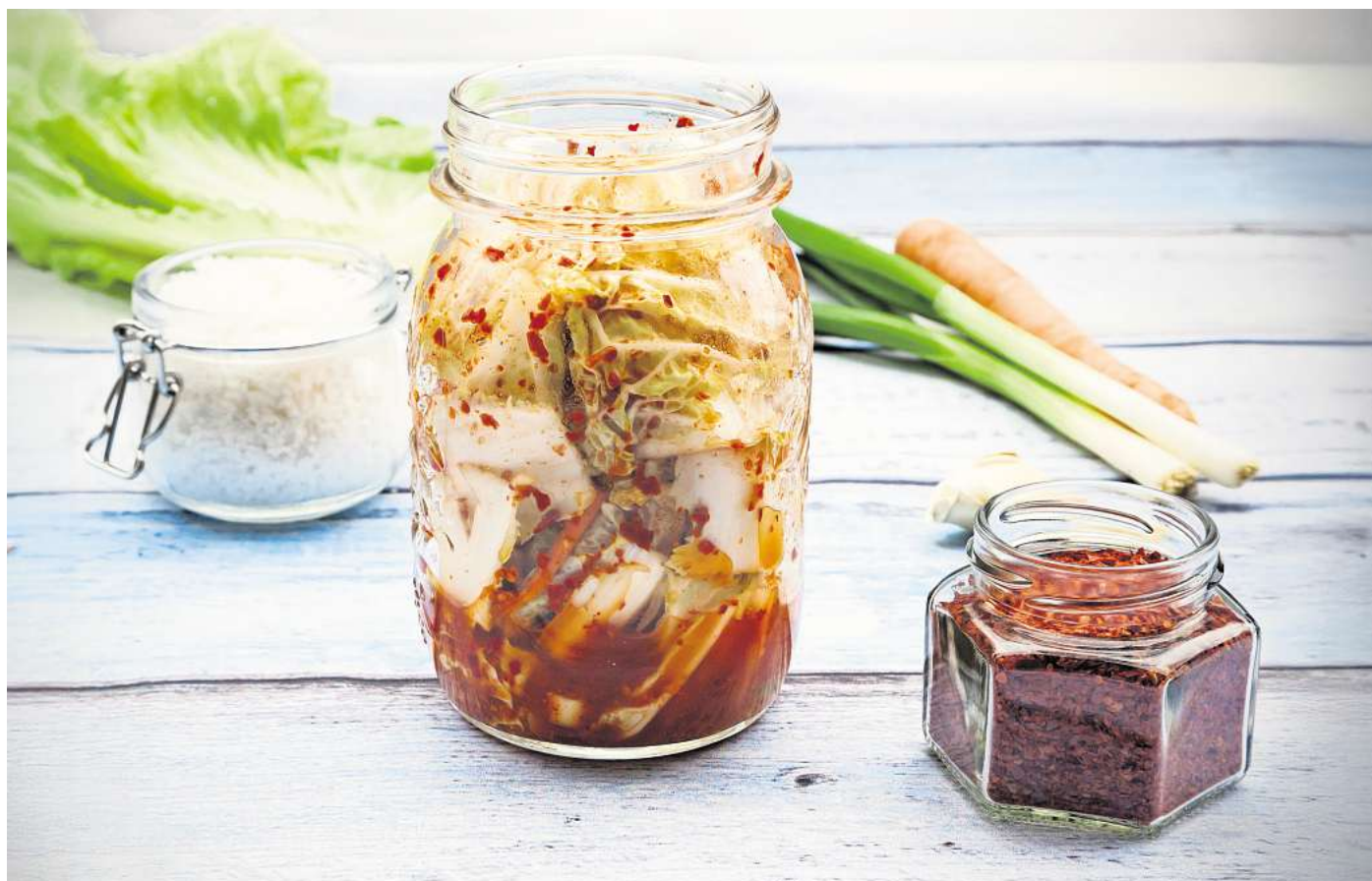
Kimchi (gesprochen: Kimtschi) ist ein Klassiker der koreanischen Küche.

Traditionell wird Chinakohl verwendet, aber auch heimische Kohlsorten eignen sich hervorragend. Neben dem Geschmack punktet Kimchi mit Vorteilen für die Gesundheit: Es ist reich an Ballaststoffen, Vitaminen und Mineralstoffen und unterstützt dank der enthaltenen Mikroorganismen eine gesunde Darmflora.