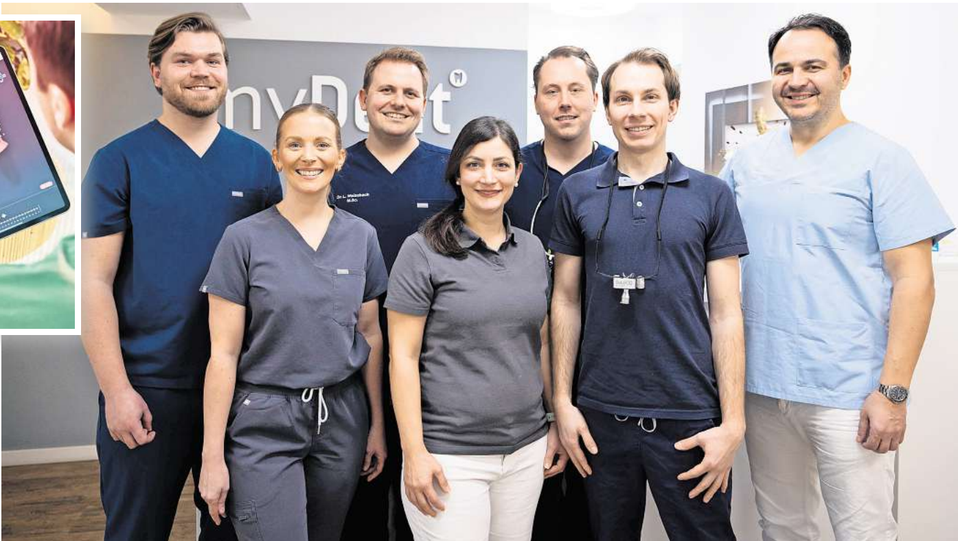
Gefragte Ansprechpartner über die Stadtgrenzen hinaus: Das Zahnärzteteam von myDent Laatzen.

Eigene, gerade Zähne sind optisch schön und tragen so zu ihrer Funktion und zur Gesundheit im Allgemeinen bei. Schief stehende Zähne hingegen können das Kauen beeinträchtigen, zur Abnutzung führen und außerdem das Kariesrisiko erhöhen.