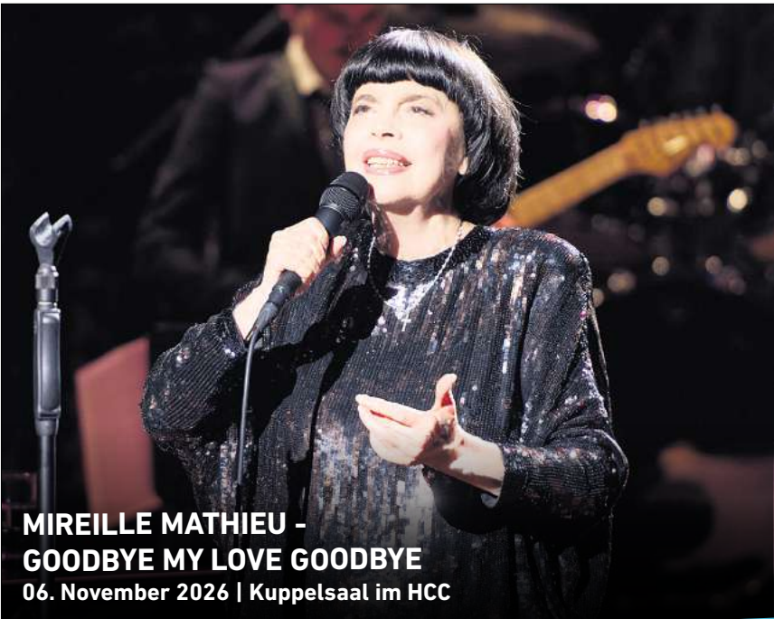
MIREILLE MATHIEU - GOODBYE MY LOVE GOODBYE 06. November 2026 | Kuppelsaal im HCC

HANNOVER. Mit einem Festgottesdienst in der Kirche St. Franziskus beginnt am Sonntag, 29. Juni, um 10 Uhr das Familienfest rund um Kirche und Pfarrheim, Dresdener Straße 29. Eröffnung mit der Marching Band der Herschelschule ist ab 11.30 Uhr. Danach warten Straßenfußball, Kett-Car-Fahrten, Tischtennis- und Basketball-Wettbewerb, Sumo-Ringen, Hüpfburg, Bastel- und Spieltische, Kaspertheater und Wurf-bude auf kleine Gäste. Größere können mit einer Hebebühne hoch hinaus und Tanz und Akrobatik bestaunen. RED