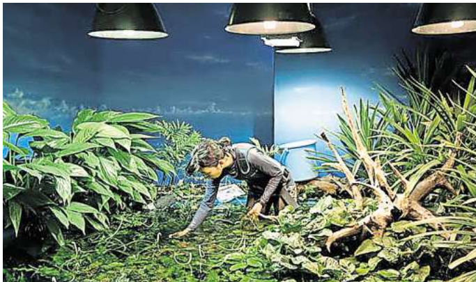
Die Ausstellung im Kubus beschäftigt sich mit dem Verhältnis zur Natur, hier „Toba Aquarium“.

Nähere Informationen und alle Termine stehen auf: atelierhaus-hannover.de/kubus