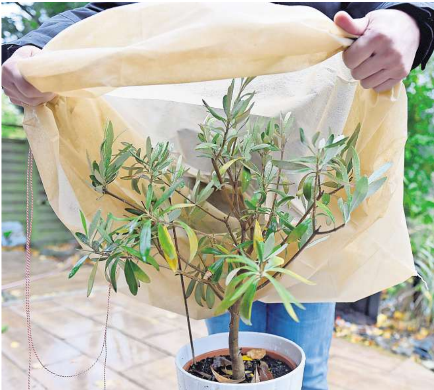
Vor Frost geschützt: Im Winter kann man den Olivenbaum mit Vlies einwickeln.

Dach und Wände in der Hauptwindrichtung schützen dann vor Nässe und Kälte. Allerdings muss man im Winter regelmäßig gießen, weil durch den Schutz kein Regen auf den Boden kommt.