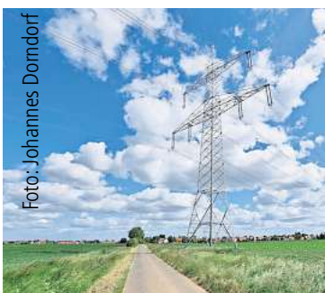
Die Leitungen bei Ingeln-Oesselse sollen mehr Kapazität bekommen. Seite 3