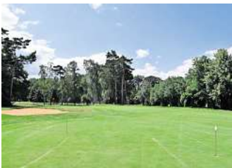
Mitten im Grünen.

HANNOVER. Am morgigen Sonntag, 8. Juni, richtet der Golfclub Hannover e.V. eines der bundesweiten Benefiz-Golfturniere im Rahmen der 44. Golf-Wettspiele zugunsten der Deutschen Krebshilfe und ihrer Stiftung Deutsche KinderKrebshilfe aus. Gemeinsam mit rund 130 Golfclubs in ganz Deutschland engagiert sich der Club für den guten Zweck. Golferinnen und Golfer sind herzlich eingeladen, ihren sportlichen Einsatz mit der Hilfe für krebskranke Menschen zu verbinden. Die Erlöse aus dem Turnier fließen direkt in die Arbeit der Deutschen KinderKrebshilfe. Für die Teilnehmenden des Turniers in Garbsen gibt es zudem einen sportlichen Anreiz: Die Brutto- und Nettosiegerinnen und -sieger haben die Chance, sich in einem Regionalfinale für das Bundesfinale am 4. Oktober 2025 im Golfpark Rotenburg-Schönbrunn zu qualifizieren. Interessierte Golferinnen und Golfer können sich für das Turnier in Garbsen anmelden. Alle Turnierpreise werden von dem langjährigen Sponsor DeKaBank, dem Wertpapierhaus der Sparkassen, gestellt.