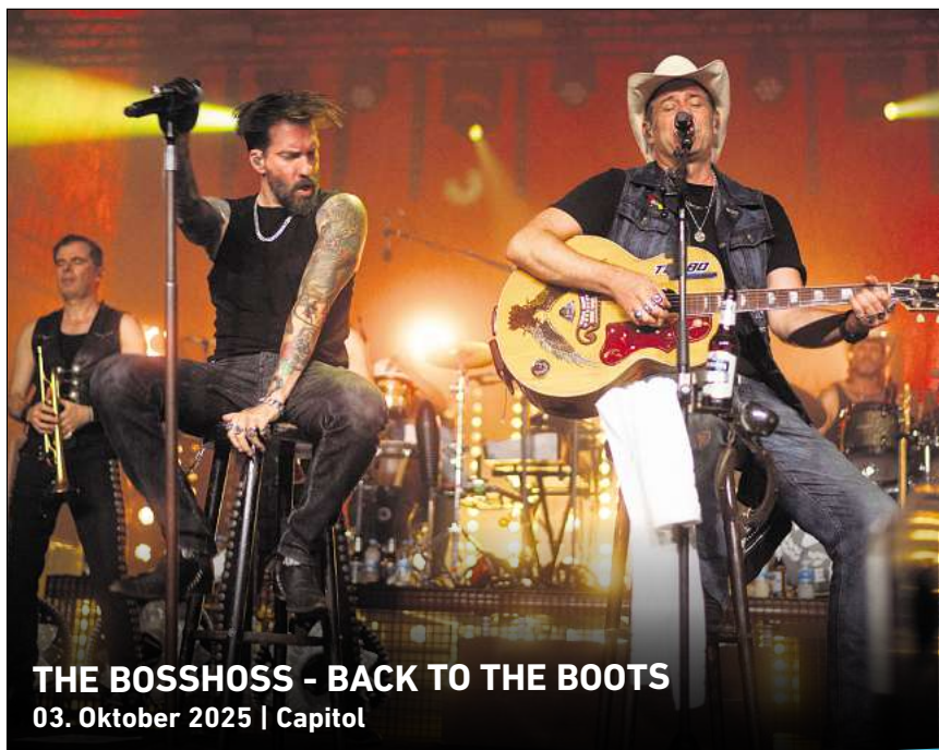
THE BOSSHOSS - BACK TO THE BOOTS 03. Oktober 2025 | Capitol

Ihr persönlicher Ticketservice der HAZ & NP