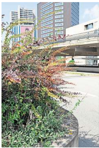
Franziska Klose fotografiert die Koexistenz von Menschen und Pflanzen.

aber auch in Gemeinschaftsgärten und Botanischen Gärten. Für ihre Arbeiten wurde sie 2024 mit dem „Hannover Shots“-Stipendium ausgezeichnet. Geöffnet ist die Ausstellung Donnerstag bis Sonntag von 12 bis 18 Uhr. Der Eintritt ist frei.