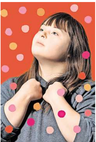
Das inklusive Theaterfestival findet im Kulturzentrum Pavillon statt.

in der Stille hören kann. Das Kollektiv „beyond buntHus“ experimentiert gemeinsam mit den Teilnehmenden mit Geräuschen – Anmeldung für die Teilnahme über anja.neideck@hannover-stadt.de . Ab 19 Uhr sind im Abendprogramm unter ande-