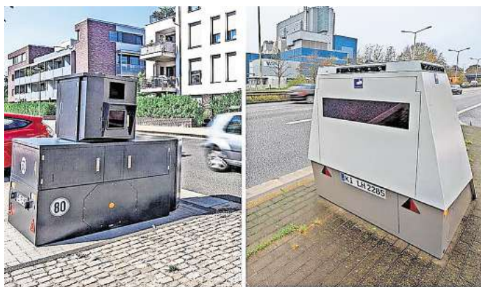
Geräte der Firmen Jenoptik (links) und Vitronic: Die Stadt Pattensen erwägt die Anschaffung eines neuen semistationären Blitzers.

Die Verwaltung bringt noch eine weitere Option ins Spiel: Das mobile Blitzgerät, das die Stadt bereits besitzt, stammt von der Firma Vitronic. „Alternativ zum Kauf oder zur Anmietung eines Komplettsystems besteht hier die Möglichkeit, lediglich den Trailer gesondert zu kaufen oder zu mieten und diesen dann außerhalb der Dienstzeiten des Ordnungsausschusses mit der bereits vorhandenen Anlage zu bestücken“, schreibt die Verwaltung in der Drucksache. Die Kosten für den Kauf der erforderlichen Komponenten betragen etwa 110.000 Euro. Die Mietkosten des Trailers ohne Messeinheit liegen bei etwa 5500 Euro pro Monat.