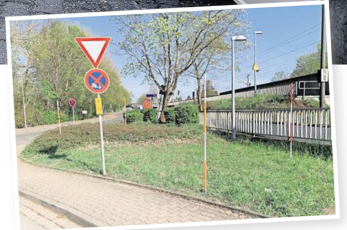
Drei Module für 84 Fahrräder: Am Bahnhof Rethen haben die Vermessungsarbeiten für die neue Bike-and-Ride-Anlage östlich und westlich der Gleise begonnen.

Zu dem geschlossenen Modul auf der Ostseite haben nur registrierte Kunden Zutritt. Diese müssen sich für das Projekt „umsteigen:aufsteigen.“ der Region angemeldet und ein Zeitfenster gebucht haben. Möglich ist das über die kostenlose App oder die Internetseite www.umsteigenaufsteigen.de . Nach erfolgreicher Buchung ist die Tür über einen QR-Code oder eine vierstelligen PIN zu öffnen. Alternativ klappt das auch per Chipkarte. Erhältlich ist die bei der Region für 5 Euro.