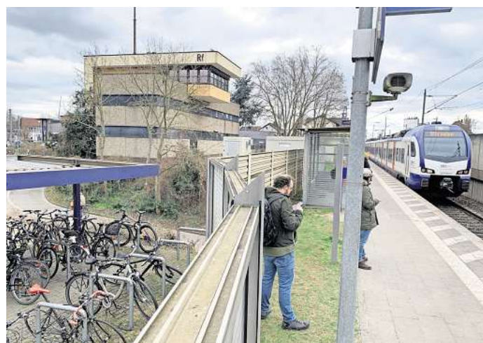
Drei Module für 84 Fahrräder: Am Bahnhof Rethen haben die Vermessungsarbeiten für die neue Bike-and-Ride-Anlage östlich und westlich der Gleise begonnen.