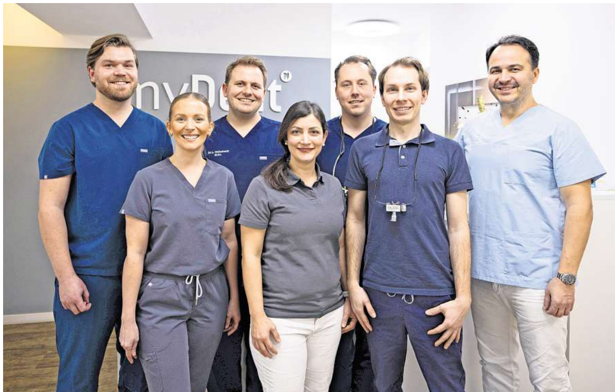
Gefragte Ansprechpartner über die Stadtgrenzen hinaus: das Zahnärzteam von myDent Laatzen

Dort informiert das myDent Laatzen-Zahnärzteteam über einen möglichen, transparenten und komfortablen Weg zu einem gesunden und schönen Lächeln. Dazu erhalten die Interessenten und Besucher der myDent Laatzen-Praxis nach einem