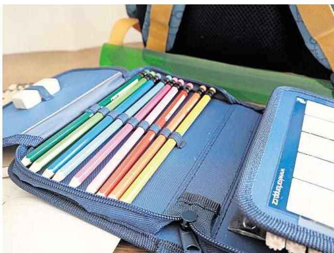
Gebrauchte und gut erhaltene Federmäppchen, Turnbeutel und Schulranzen werden aktuell gesammelt für einen guten Zweck.