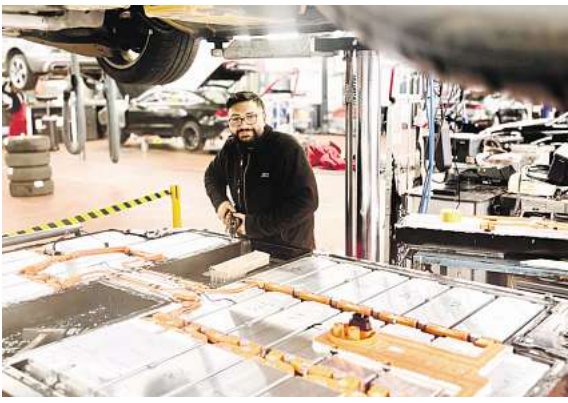
Auch der Werkstatt- und Karosseriebaubereich wird komplett neu gebaut.

Audi Zentrum Hannover Vahrenwalder Str. 303 30179 Hannover Telefon: (0511) 860560 hannover-audi.de