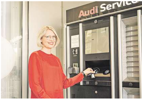
Eine 24-Stunden Audi Service Station wird es weiterhin geben. Hier kann man rund um die Uhr abgeben, abholen, mieten und bezahlen.