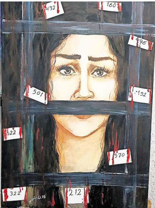
Aus der Ausstellung in der Marktkirche – Sherin Dawoud: „Keine Menschen, sondern Zahlen“, 2025. Courtesy of the artist

Musik und Frauenrechte treffen auch bei der Veranstaltung „Femme*tastic“ in der Bürgerschule / Stadtteilzentrum Nord-