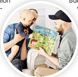
Spaß mit Bilderbüchern.

Einen besonderen Stellenwert hat in diesem Jahr das Programm „Babys in der Bibliothek“, das von der Musikschule Hannover stündlich angeboten wird. Beim mehrsprachigen Bilderbuchkino werden Geschichten lebendig. Um 11 Uhr beginnt „Der Fuchs ruft nein“ in über 40 Sprachen. Ab 13 Uhr gibt es zweisprachiges Bilderbuchkino in Deutsch und Persisch, ab 14 Uhr in Deutsch und Türkisch, sowie ab 15.30 Uhr in