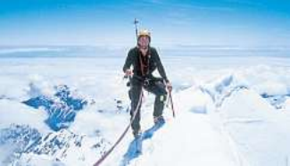
„Soundscape“ zeigt Bergsport aus neuen Perspektiven.