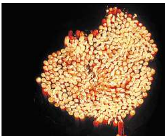
Finissage: Mit „BrennWEITEN@ArtAffair“ verabschiedet sich der Kunstverein Kunsthalle Faust.