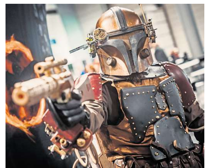
Scienc-Fiction-Sets, Cosplay und jede Menge Spielspaß warten auf dem Messegelände.

Ihr persönlicher Ticketservice der HAZ & NP