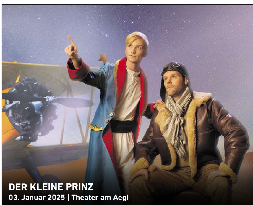
DER KLEINE PRINZ 03. Januar 2025 | Theater am Aegi

In den HAZ & NP Geschäftsstellen Hannover, Lange Laube 10 Neustadt, Am Wallhof 1 Burgdorf, Marktstraße 16 Langenhagen, im CCL, Marktplatz 5 Theater am Aegi, Aegidientorplatz 2