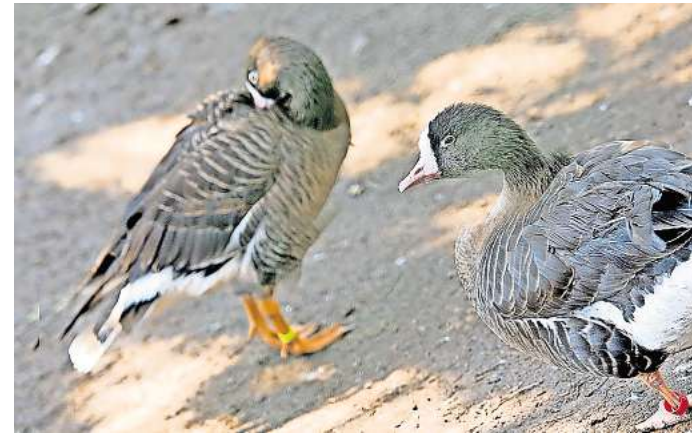
Zwerggänse sind an ihren schwarzen Bauchstreifen, ihrer weißen Stirn und dem gelben Augenring zu erkennen.