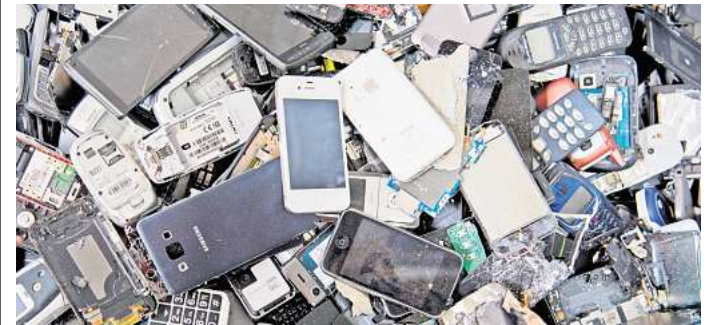
Hersteller und Importeure elektrischer Geräte sind verpflichtet, ihre Geräte nach Ende der Lebensdauer zurückzunehmen.

St. Johannis Apotheke Laatzen Pettenkoferstraße 2 30880 Laatzen Tel. 0511 / 69 17 69 service@meine-apotheke-laatzten.de