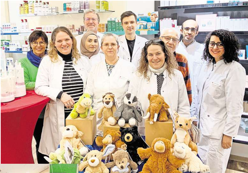
Berät fachlich versiert und individuell: das Team der Laatzeners St. Johannis-Apotheke

Die studierte Pharmazeutin und approbierte Apothekerin ist seit Jahresbeginn Inhaberin der seit 2011 beliebten St. Johannis-Apotheke, zu deren Mitarbeiterinnen sie bereits fast von Anfang an gehört. Aktuell besteht das versierte Apotheken-Team aus 15 Fachkräften, darunter fünf Apotheker/-innen, sowie sieben Pharmazeutisch-technischen Assistentinnen und Assistenten.