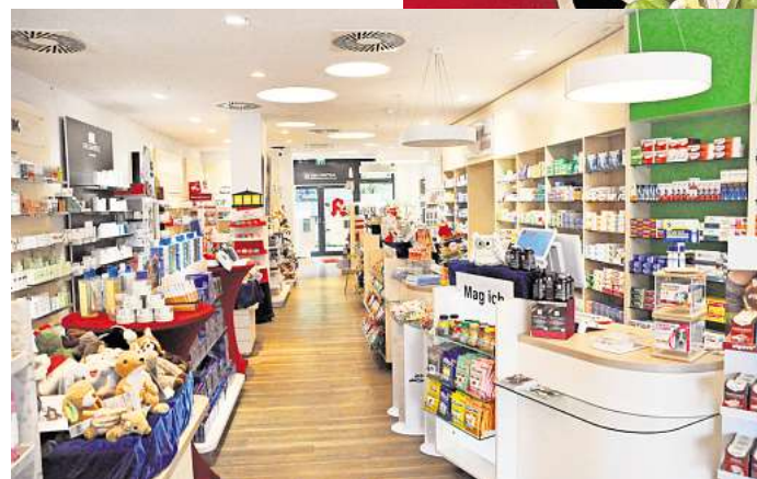
Bietet mehr als nur Medikamente: die St. Johannis-Apotheke in Laatzens Pettenkoferstraße 2

Montags bis freitags zwischen 8 und 19.30 Uhr, sowie samstags von 9 bis 18 Uhr, werden hier nicht nur apothekenpflichtige Arzneimittel und Nebensortimentsartikel für Kosmetik und Zahnpflege, Diätetik und Tees, Verbandstoffe und vieles mehr, abgeholt. Die fachlich geschulten Laatzeners Gesundheitsexperten beraten auf Wunsch individuell zu Arzneimitteln und Al-