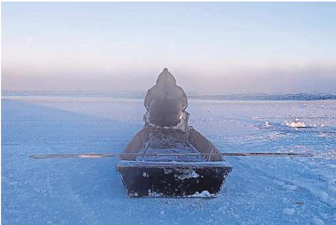
Joar Nango: „Flow Edge“, 2023.