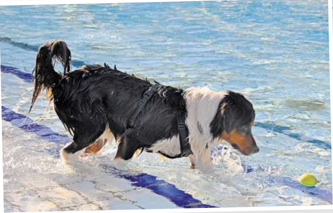
Wasserscheue und Wasserratten beim Hundeschwimmen in Arnum: Auch der Berner Senn-/Australian Shepherd-Mischling Toker (3) bekommt von Wasser nie genug.