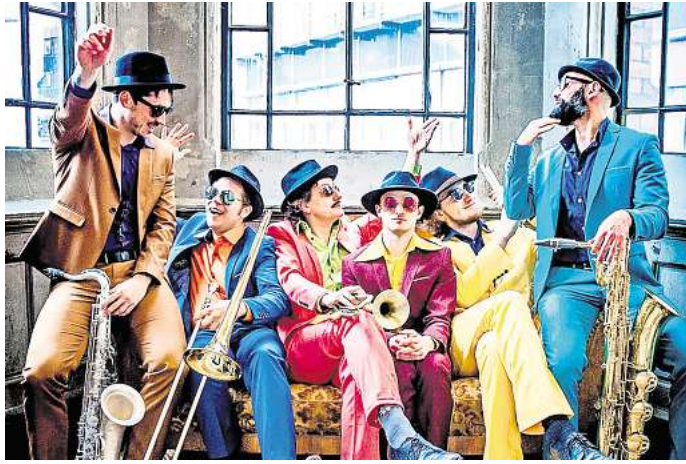
Heißer Tipp in der Brass-Band-Szene: Brazzo Brazzone stehen für unverschämten World Brass Groove in knallbunten Outfits.