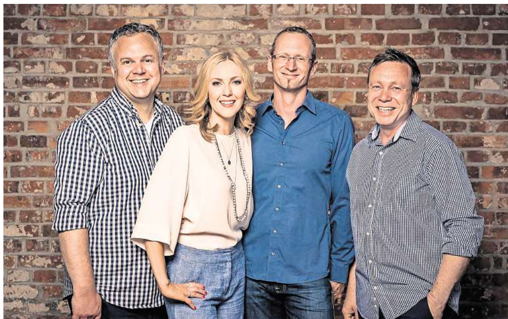
Mal swingend, mal soulig: Die Ellingtones nehmen das Publikum mit auf eine faszinierende Entdeckungsreise durch die Musik der letzten Jahrzehnte.

bensbejahend, mit bester Laune und Freude an der Musik. Drei Bands kommen auf die Bühne. Mit Vollgas beginnt das Konzert nachmittag um 11 Uhr mit Brazzo Brazzone einer Brass-Band mit sechs italienischen Bläsern um Bandchef Daniel Zeinoun.