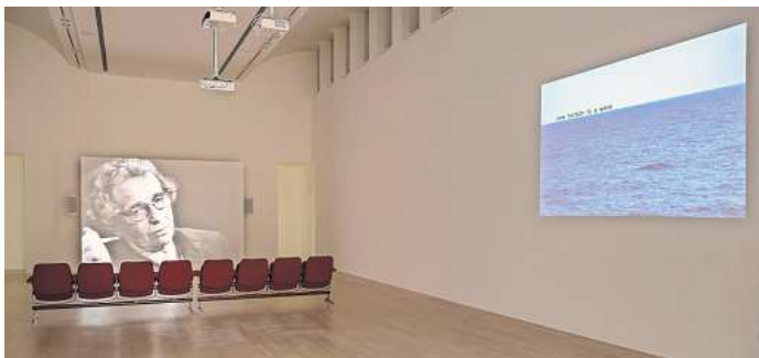
Die Kestner Gesellschaft widmet sich in einer Ausstellung dem Wirken von Hannah Arendt.