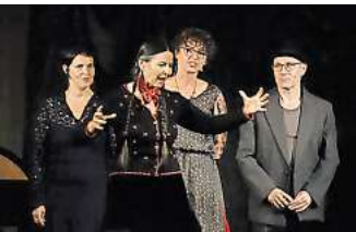
Finale: Nach 27 Jahren Erzählfestival findet es zum letzten Mal statt.