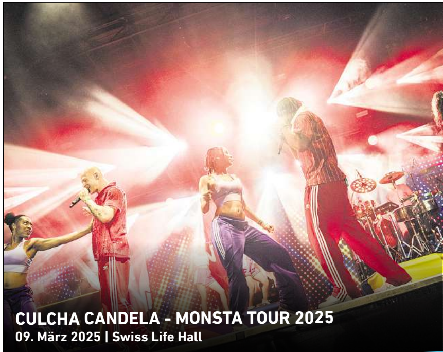
CULCHA CANDELA - MONSTA TOUR 2025 09. März 2025 | Swiss Life Hall

Ihr persönlicher Ticketservice der HAZ & NP