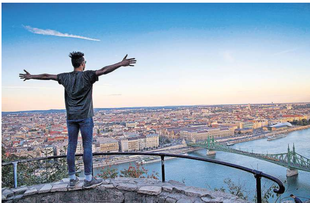
Reisefotografie: Die Gruppe LANDMARKer präsentiert ihre Bilder in der GAF.

Zeichnung und Porzellan ausstellen. Am Sonnabend können Interessierte sich ab 16 Uhr auf einen Cappuccino mit den Künstlern treffen. Am Sonntag entstehen