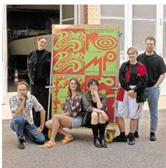
Zum ersten Mal beim Zinnober dabei: Atelier Pomp