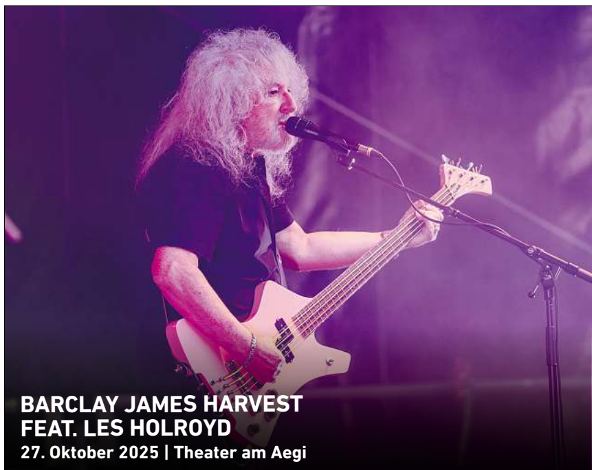
BARCLAY JAMES HARVEST FEAT. LES HOLROYD 27. Oktober 2025 | Theater am Aegi

Ihr persönlicher Ticketservice der HAZ & NP