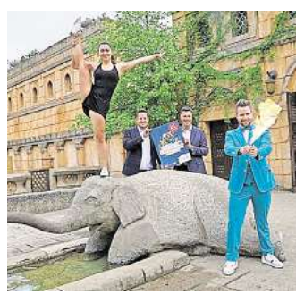
Akrobatik, Comedy und Zauberkunst: Der Zoo Hannover lädt ein zu magischen Nächten.