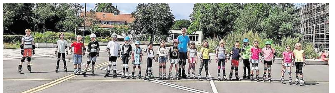
„Spiel und Spaß auf 8 Rollen“ hieß es auf dem Schulhof der KGS Hemmingen.

Der Asphalt brannte an diesem Tag nicht nur unter der Mittagssonne, die vom Himmel prallte, sondern auch unter den über 200 Rollen der teilnehmenden Inlineskaterinnen und -skater. Mit großer Begeisterung und vollem Einsatz meisterten sie verschiedene Techniken, da-