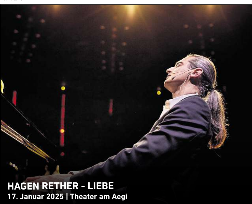
HAGEN RETHER - LIEBE 17. Januar 2025 | Theater am Aegi

Telefonische Bestellannahme: 0511 12123333, online: tickets.haz.de // tickets.neuepresse.de