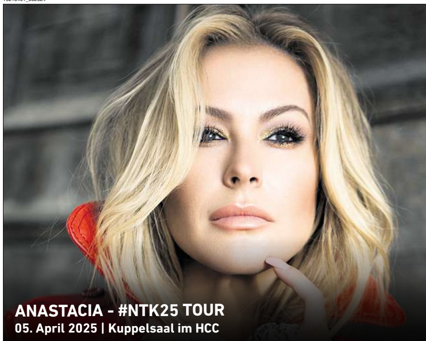
ANASTACIA - #NTK25 TOUR 05. April 2025 | Kuppelsaal im HCC

Ihr persönlicher Ticketservice der HAZ & NP