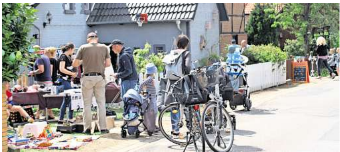
Vieles für Hobby, Haus und Garten gibt es am 1. Juni beim Flohmarkt in Ingeln-Oesselse zu entdecken.

Sieht sie sich auch in einer Art Vorbildrolle für andere? Da winkt die 20-Jährige ab. „Ehrenamtliches Engagement ist immer ein Zusatz, ein Add-On“, sagt die Pattenserin. Das sollte nicht von anderen Menschen erwartet werden. „Viele Menschen haben aus finanziellen oder anderen Gründen genug damit zu tun, das Leben überhaupt zu bewältigen. Da ist ehrenamtliches Engagement dann einfach nicht möglich.“