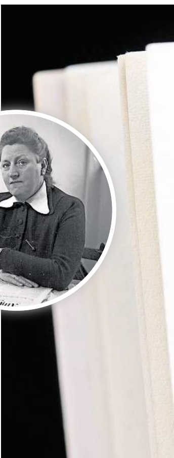
Das Grundgesetz der Bundesrepublik feiert in diesem Jahr seinen 75. Geburtstag. Es wurde am 23. Mai 1949 erlassen.

Wünschenswert wäre eine entsprechende Korrektur im Stil der politischen Debatten: Deutsch-