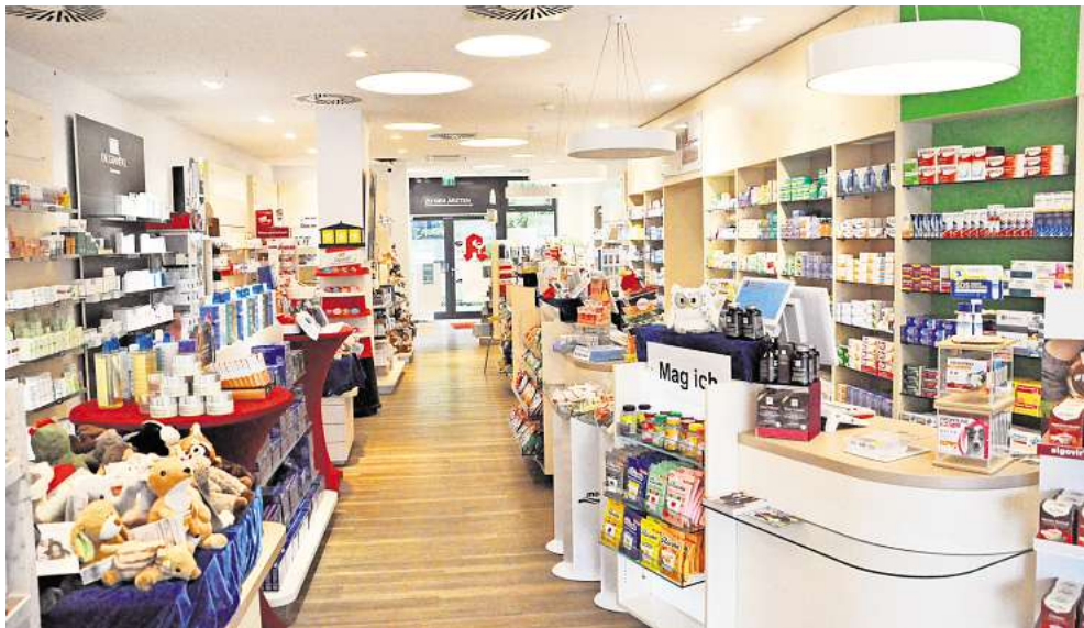
Bietet mehr als nur Medikamente: die St. Johannis-Apotheke in Laatzens Pettenkoferstraße 2.

kunden über 250 Parameter be-stimmt, die Hinweise auf Dysba-lancen und Abweichungen ge-ben können. Vom 13. bis 17. Mai wird mit Termin außerdem Vita-min D gemessen.