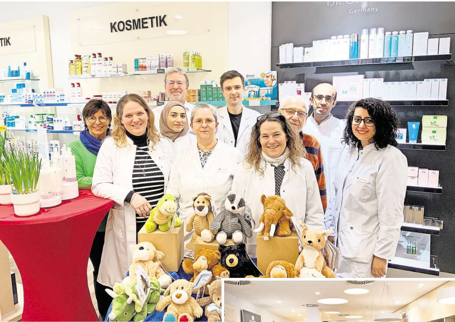
Berät fachlich versiert und individuell: das Team der Laatze-ner St. Johannis-Apotheke.

Die St. Johannis-Apotheke in Laatzens Pettenkoferstraße 2 bietet mehr als nur die richtige Arznei