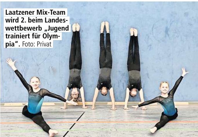
Laatzener Mix-Team wird 2. beim Landeswettbewerb „Jugend trainiert für Olympia“.