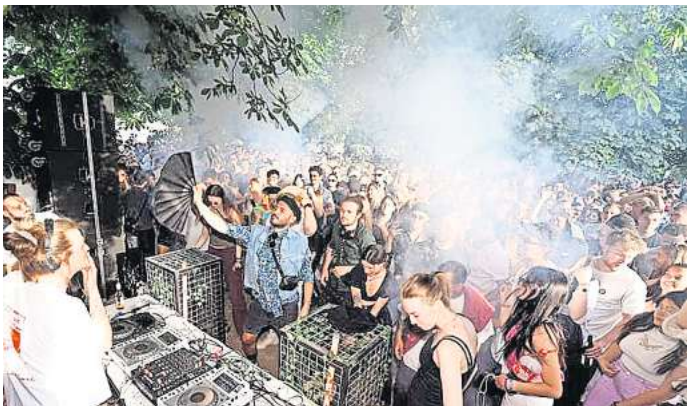
Tanzen unterm Sommerhimmel mit Live-DJs.

Das komplette Programm auf den hannoverschen Bühnen der diesjährigen Fête des la Musique ist online unter fete-hannover.de zu finden.