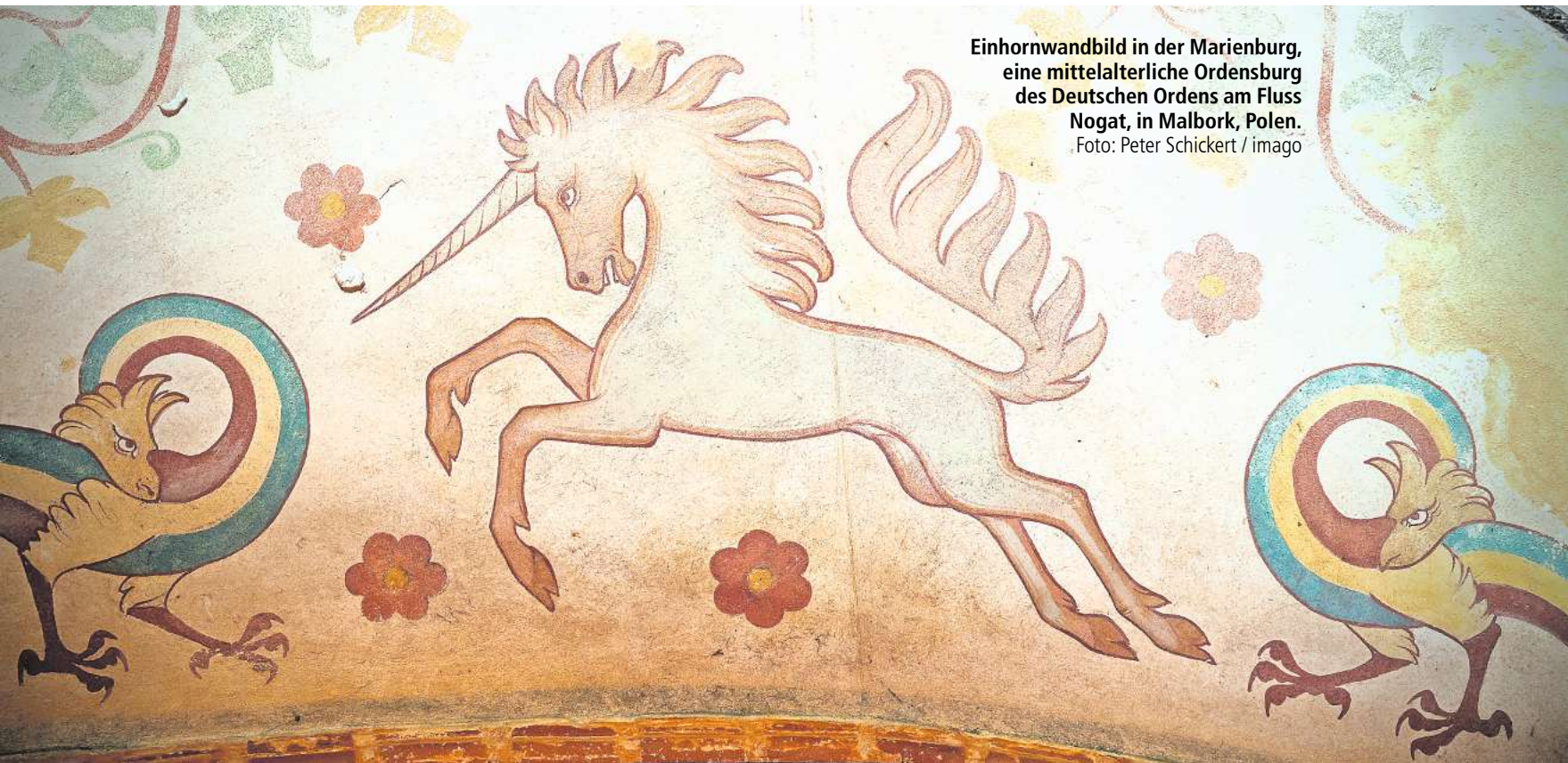
Einhornwandbild in der Marienburg, eine mittelalterliche Ordensburg des Deutschen Ordens am Fluss Nogat, in Malbork, Polen.