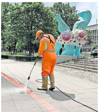
Frische Farbe für den Roten Faden.

bin froh, dass der Rote Faden wieder sichtbar und pünktlich zur Sommersaison fertig geworden ist.“ Begleitend zur Auffrischung hat die HMTG eine neue Broschüre zum Roten Faden mit allen Informationen zu den Sehenswürdigkeiten aufgelegt, sie liegt in der Tourist-Info am Ernst-August-Platz aus.