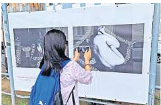
Multimediale Freiluft-Ausstellung über Lebenswege, die sich in Hannover kreuzen.