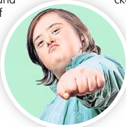
Inklusiv: Theaterfestival Klatschmohn.

ermäßigt 4 Euro. Kartenvorverkauf unter Telefon (0511) 2355550 oder E-Mail an tickets@pavillon-hannover.de .