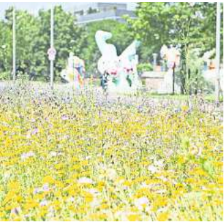
Hannover blüht auf: Wie hier am Leibnizufer.

An den neuen Flächen stellt die Stadtverwaltung kleine Informationsschilder auf, die auf den besonderen Wert der Areale für den Artenschutz und die Artenvielfalt hinweisen: „Hier entsteht eine Blühfläche für Insekten“ oder „Hier entsteht ein Habitat für Insekten“, heißt es da. Wildbienen und Falter etwa sind auf diese heimischen Wildpflanzen spezialisiert. „Deshalb ver-