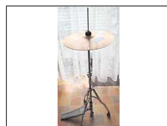
Chareston, mit Meindl Becken, HH Top Soundwave, 14 Zoll. Preis: 150 € 0511 - 455686