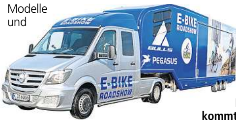
Der ZEG-Showtruck kommt zu Stadler.

und Kompakträder, Lastenräder, Fahrräder für Urban und Lifestyle - vom Einsteiger-Mountainbike bis zum Carbon-Renner für den Profisport. Dazu gibt es Infos über die neuesten Modelle und