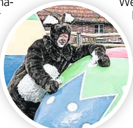
Der Osterhase auf Meyers Hof.

HANNOVER. Am Ostersonntag, 9. April, wird es ganz einfach, den Osterhasen zu finden. Im Großen Garten, Alte Herrenhäuser Straße 1, hoppeln sogar mehrere im Großen Parterre und haben Schokolade für Kinder im Körbchen. Von 10 bis 17 Uhr stehen beim Osterspaziergang in den Gärten außerdem Spiele, Märchen und Bastelaktionen auf dem Programm. Die Wasserspiele sprudeln durchgehend und es erklingen Frühlingsgedichte. Niedliche Osterküken können bestaunt werden. Das Museum Schloss Herrenhausen präsentiert die neue Sonderausstellung „Natur ist Kultur“, Grauwinkels Schlossküche bietet Snacks und Getränke an. Der Festsaal der Galerie ist zur Besichtigung geöffnet, Führungen beginnen um 13, 14 und 15 Uhr. An der Graft im