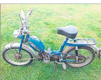
Suche altes Mofa Moped Motorrad auch defekt oder total verrostet ☎ (01 51) 11 52 02 65

Verkaufe meinen Renault Clio 16V, Bj 2011, 105.000 km, Farbe Grau Silber, TÜV Neu 01.2025 Allwetterreifen Neu, Service Neu Scheckheft gepflegt 4.5L Verbrauch günstig im Unterhalt. Fahrzeug im top Zustand. Von privat. Preis: 4750,- Euro 01782488730