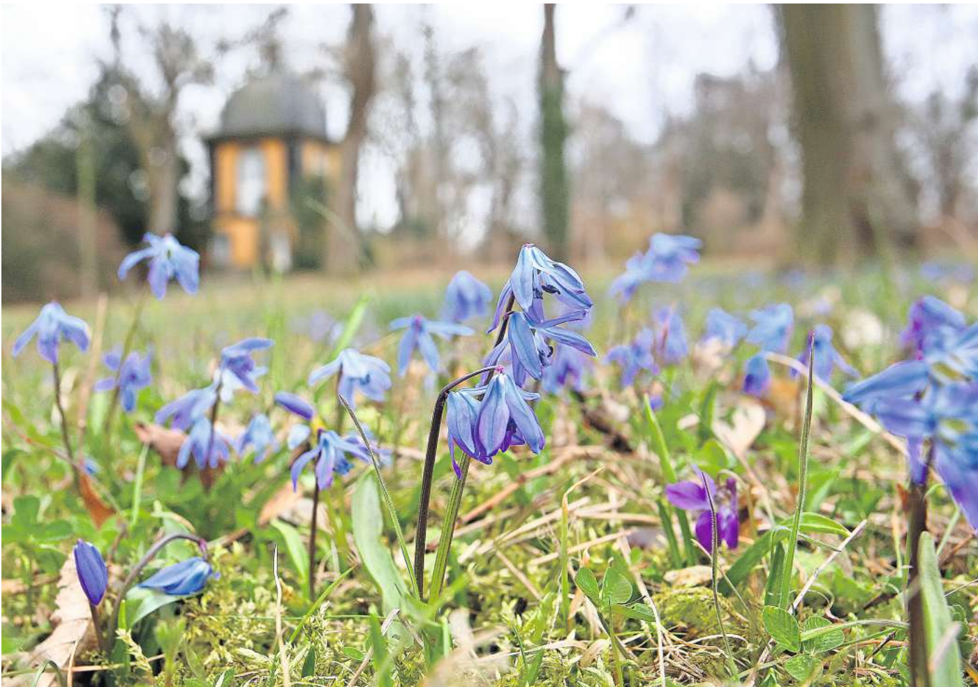
Die Scillablüte auf dem Lindener Berg.