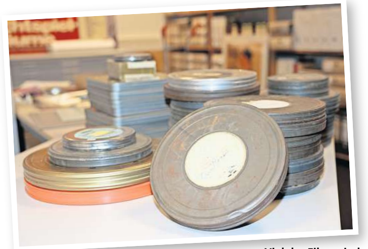
Viel der Filme sind noch auf herkömmlichen Filmrollen.

Der Historiker war 1995 ans Kulturarchiv der heutigen Hochschule Hannover gekommen und hatte sich früh darum gekümmert, Filme als historische Dokumente zu bewahren. Unter seiner Ägide wurde 2016 das Filminstitut aus der Taufe gehoben. Regelmäßig veröffentlicht