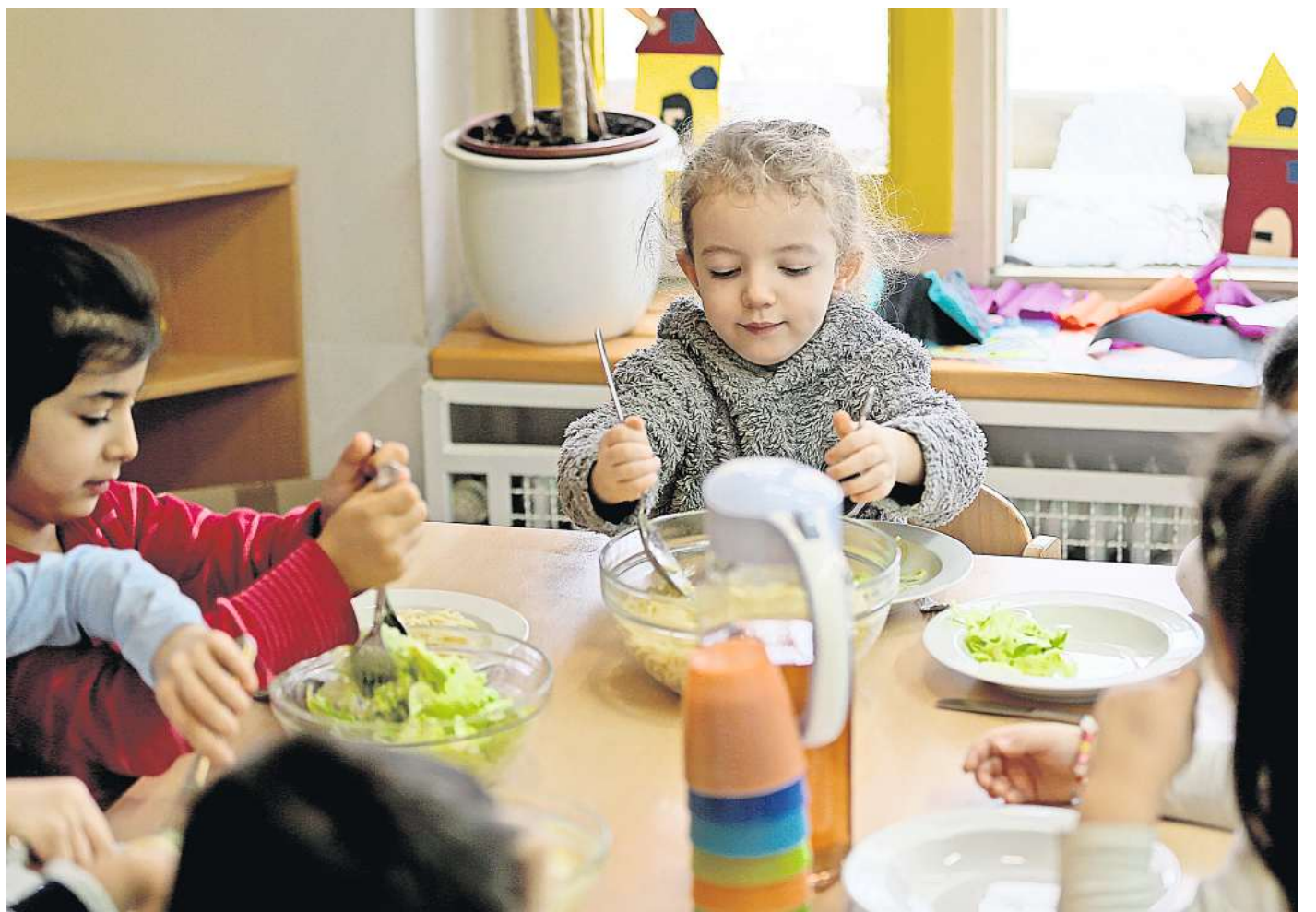
Essen als Gemeinschaftserlebnis: In den meisten hannoverschen Kitas steht mittags Selbstgekochtes auf dem Tisch.

ten, die von Lieferanten bezogen werden. Die Verpflegung in den städtischen Kitas folge den Empfehlungen der Deutschen Gesellschaft für Ernährung. Dazu gehören Vorgaben wie nur einmal in der Woche Fleisch, aber viel Obst und Gemüse anzubieten und auf regionale und ökologisch angebaute Zutaten