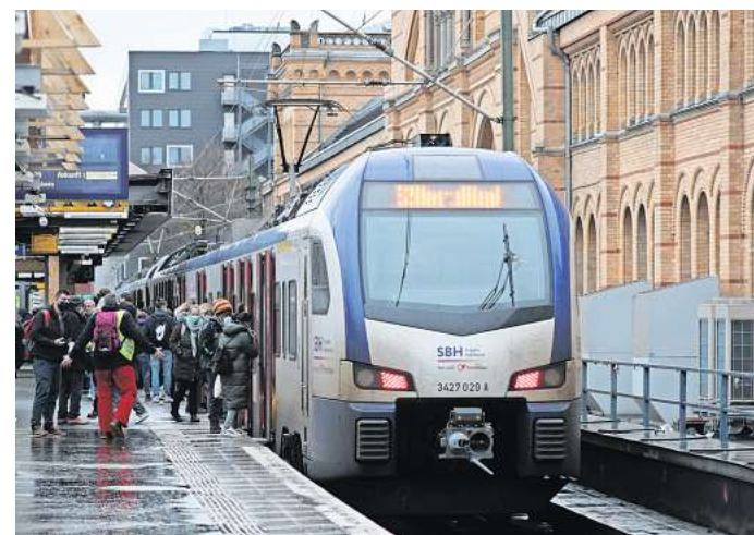
Scheint besser zu werden: Die S-Bahn lässt ihre Fahrgäste nicht mehr so häufig im Regen stehen.

Unterdessen beklagen Fahrgäste, dass an den Automaten der Transdev entgegen der Ankündigungen häufig keine Fahrkarten für den Fernverkehr der Deutschen Bahn verfügbar seien. Laut Block handelt es sich um ein technisches Problem, an dessen Behebung gearbeitet werde.