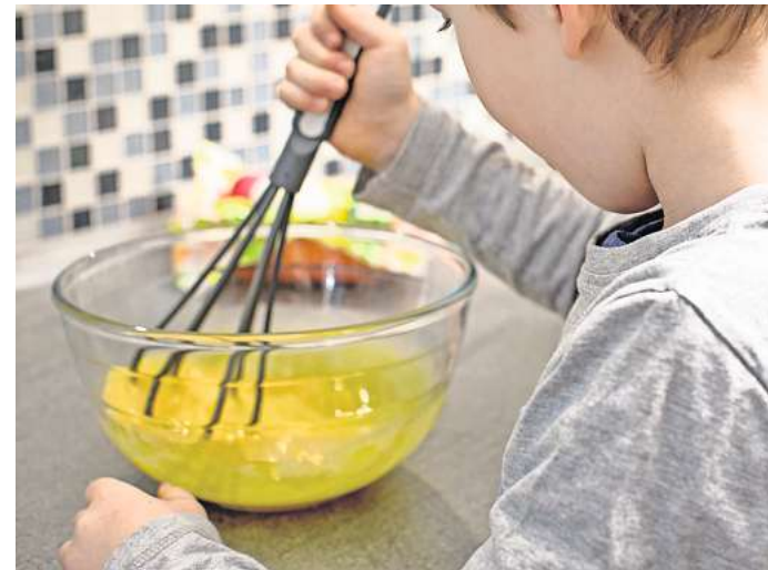
Teig rühren, Gemüse schneiden - Kinder können schon früh beim Kochen mithelfen.

Einige Träger erheben von Eltern noch extra Beiträge, etwa für ausschließlich Biokost. So wie die Nachfrage nach selbst gekochtem Essen steige bei den Familien auch der Wunsch nach Sonderkost, berichten die Träger und Essenslieferanten, etwa aus religiösen oder gesundheitlichen Gründen, dem trage man selbstverständlich Rechnung. In Kitas in bestimmten Stadtteilen mit vielen muslimischen Familien gebe es grundsätzlich nur Halal-Kost (Fleisch von Pflanzenfressern, Frischmilch, frisches Obst und Gemüse) oder stehe zumindest kein Schweinefleisch auf dem Speiseplan.