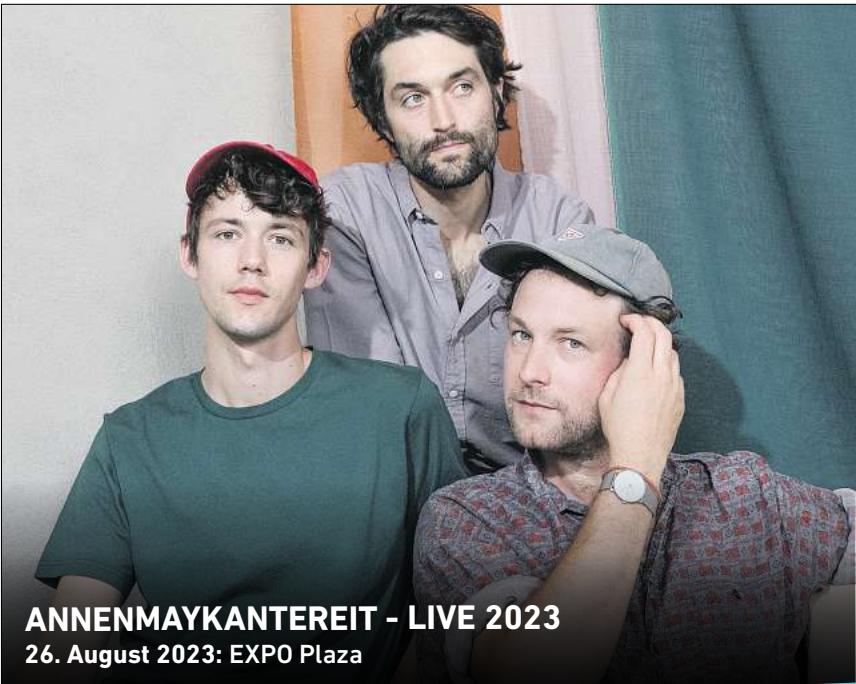
ANNENMAYKANTEREIT - LIVE 2023 26. August 2023: EXPO Plaza

Ihr persönlicher Ticketservice der HAZ & NP