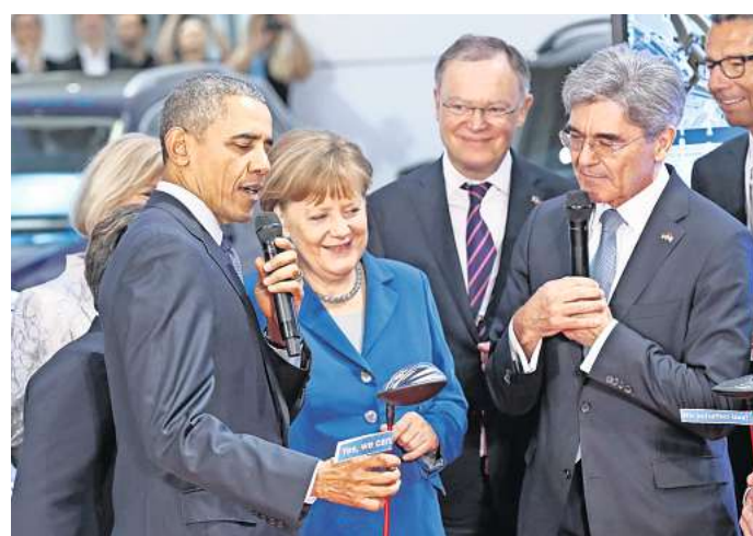
Beim Messebesuch von Barack Obama (hier beim Rundgang mit Bundeskanzlerin Angela Merkel) wollte der CIA mitreden.

... über Dinge, die er aus dem Büro mitnimmt: „Eigentlich nicht viel. Ein paar Andenken aus der Vitrine, die meisten stammen aus dem Ausland. Zum Beispiel eine Fellmütze, die ich bei einem zehntägigen Sibirienbesuch bekommen habe. Es war wirklich sehr kalt, um die minus 36 Grad. Bei meiner Haarpracht durchaus hilfreich.“