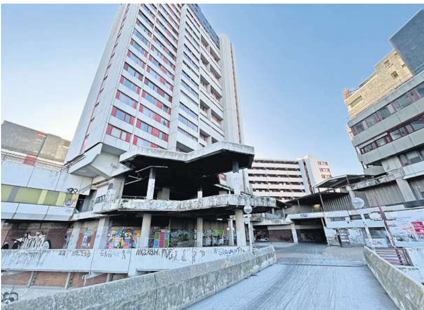
Das Ihme-Zentrum in Hannover-Linden.

Kürze etliche Hundert Arbeitsplätze aus der umstrittenen Immobilie ausgelagert. Zuletzt hatte die Verwaltung Ende 2021 den Fachbereich Jugend und Familie plangemäß aus dem Ihme-Zentrum umgesiedelt. Die 470 Beschäftigten sitzen jetzt in einem frisch modernisierten Bürohaus am Thienlenplatz mit Kantine und ohne Taubendreck, Dauerbaustellen und zugige Fenster. Ähnlich gut trifft es nun der Fachbereich Senioren. Die Beschäftigten ziehen vom 20. März an in die erst zehn Jahre alte Büroimmobilie an der Ecke Oster- und Röselerstraße um, in der bis vor Kurzem die Deutsche Hypo, die Immobiliensparte der Nord/LB, residierte. In dem Gebäude mit der runden Fassaden-ecke, das auf den ersten Blick etwas dem Kröpcke-Center ähnelt, hat die Stadtverwaltung zuletzt schon andere Arbeitsbereiche untergebracht. Und der Aderlass im Ihme-Zentrum geht weiter. In Kürze wird der Energieversorger Enercity seinen Büroturm räumen, wenn seine neue Verwaltungszentrale auf der gegenüberliegenden Seite der Ihme am Glockseeufer bezugsfertig ist. Die Stadt hat eigentlich einen Vertrag mit Windhorsts Gesellschaft, demzufolge sie ab Som-