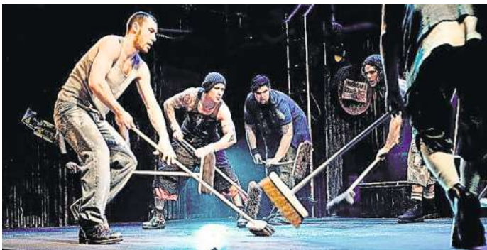
„Stomp“ kommt ins Theater am Aegi.

Die Premiere ist am Dienstag, 21. März, ab 19.30 Uhr. Weitere Termine sind bis zum 26. März von Dienstag bis Freitag ab 19.30 Uhr, Sonnabend ab 15.30 und 19.30 Uhr sowie Sonntag ab 14.30 und 18.30 Uhr. Tickets gibt es ab 22 Euro zuzüglich Gebühren im Vorverkauf. RED