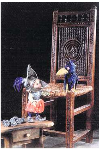
Ritter Pumperhos sucht einen Freund.

schen voller Gold und Honigbonbons und einer klaren Mission: Er will sich von den Preziosen einen Freund kaufen. Ob das so einfach gelingt? Müllers Sohn Karlemann hat jedenfalls einiges mitzuteilen, und dann ist da