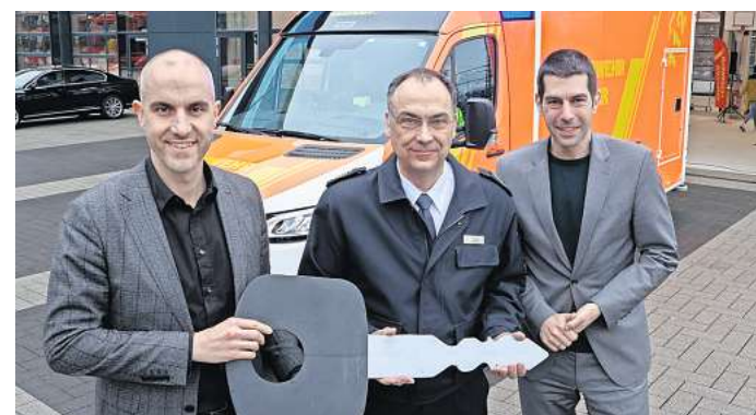
Schlüsselübergabe: Bei dem eRettungswagen (eRTW) mit der Modellbezeichnung „Orten ET55M“ handelt es sich um das erste Serienfahrzeug seiner Art – europaweit.