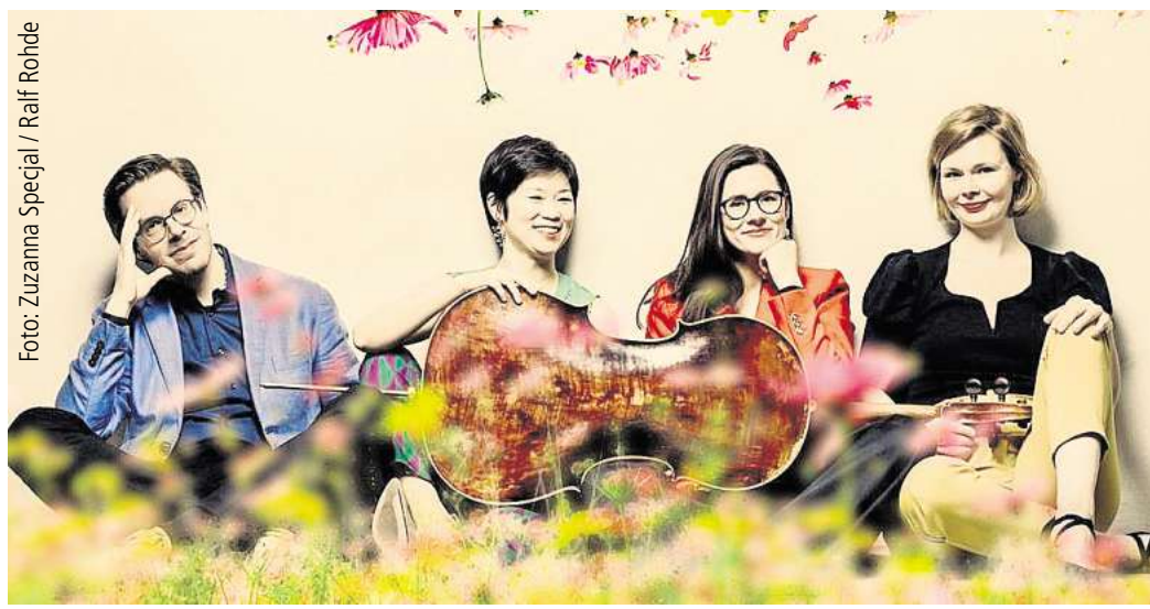
Klassik-Open-Air: Das FlexEnsemble bringt sein Sommerfestival ins Hölderlin Eins.

und einer Prise Punk. Der Eintritt ist frei. Nach längerer Pause kehrt das More Fire Festival am Sonnabend, 13. Juni, ab 15 Uhr im Béi Chéz Heinz, Liepmannstraße 7B, zurück. Draußen läuft von 15 bis 21 Uhr ein Familienfest mit Live-musik, Kulturprogramm, Kinderattraktionen, internationalem Essen und Ständen. Drinnen geht es von 20 bis 6 Uhr auf zwei Floors mit Reggae, Dancehall, Afrobeats, Drum&Bass, Jungle, Breakbeats, Hip-Hop und Funk weiter. Das Tagesticket beziehungsweise Familienticket kostet 10 Euro und gilt von 15 bis 21 Uhr nur im Hof; Kinder und Jugendliche bis 16 Jahre haben freien Eintritt. Das Tag- und Nachtticket beziehungsweise Festivalticket kostet 25 Euro und gilt ab 18 Jahren. Ferienbeginn für alle ab 14 Jahren feiert die Disco ALL-IN am Freitag, 19. Juni, von 18 bis 21 Uhr im Freizeithaus Linden, Windheimstraße 4. Die School's Out Party richtet sich an Menschen mit und ohne Behinderung, kommt ohne Alkohol und ohne Anmeldung aus und setzt auf bunte Lichter, Musik, Snacks und sommerliche Getränke. Der Eintritt ist frei.