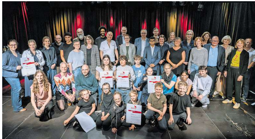
Preisverleihung im Kulturzentrum Pavillon: Mit der Vergabe des „KulturKometen“ zeichnen die Stiftung Kulturregion Hannover und die TUI Stiftung besonderes Engagement von Schulen der Region Hannover im Kulturbereich aus.