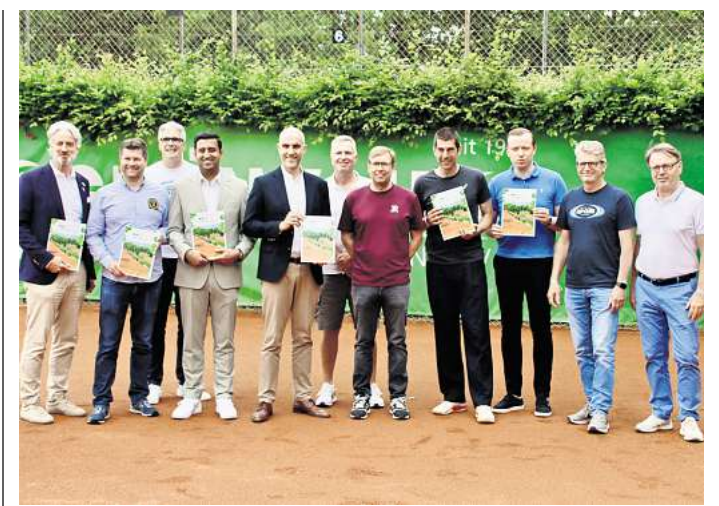
Rund 350 Gäste, darunter Mitglieder, Familien, Ehemalige sowie Vertreterinnen und Vertreter aus Politik, Sport und Stadtgesellschaft, kamen zusammen, um auf die Vereinsgeschichte zurückzublicken und den Blick nach vorn zu richten.