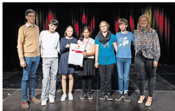
Preisträgerprojekt der Hartwig-Claußen-Schule: die neue Theater-AG.