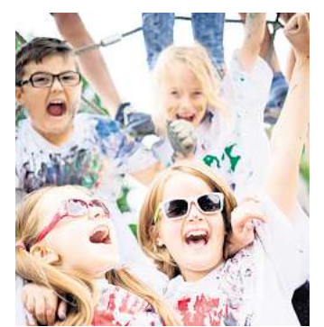
Der JuKiKs bietet wieder viele Ferienaktionen.

Die JuKiKs-Broschüre 2026 liegt in den Einrichtungen des Stadtteils aus. Alle Termine und Informationen gibt es außerdem online unter jukiks.de . RED