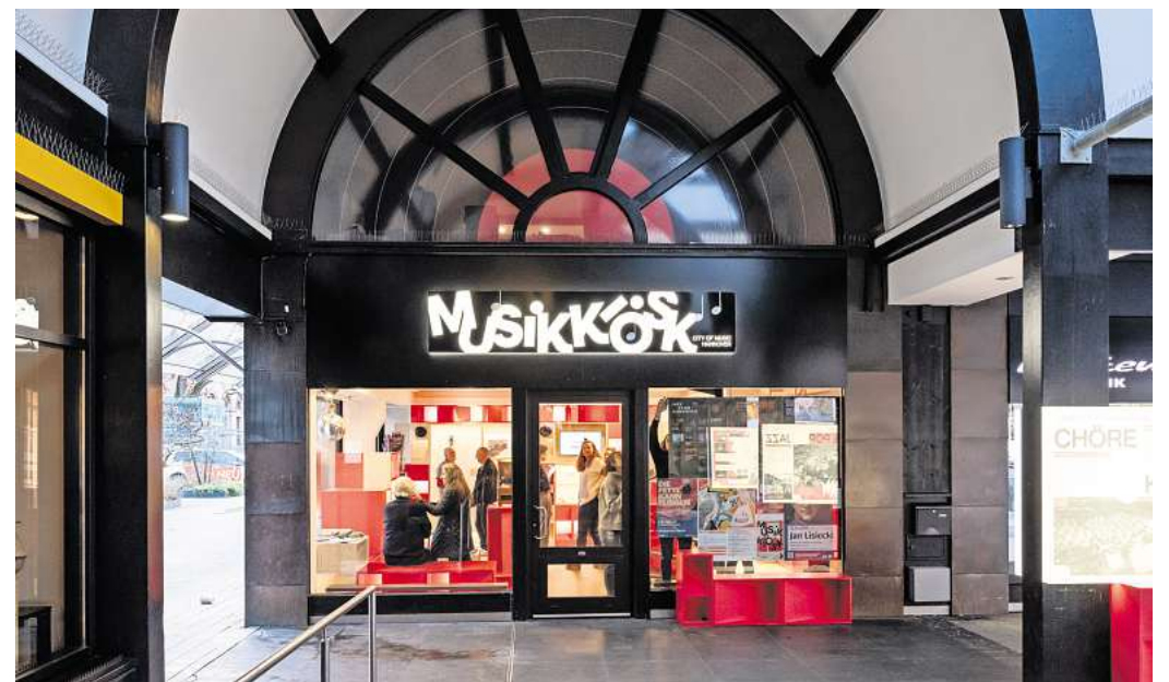
Der MusikKiosk am Kröpcke, der 2024 zum Jubiläumsjahr zur Feier von zehn Jahren UNESCO City of Music Hannover installiert wurde, soll weiterentwickelt werden.

Entstanden ist das Papier in einem breit angelegten Beteiligungsprozess. Mitgewirkt haben Akteurinnen und Akteure aus Musikszene, Kulturinstitutionen, Musikwirtschaft, Verwaltung und Politik. Oberbürgermeister Belit Onay sieht in der Strategie deshalb auch eine Antwort auf die Verantwortung, die mit dem UNESCO-Titel verbunden ist. „Die Auszeichnung Hannovers als UNESCO City of Music ist für