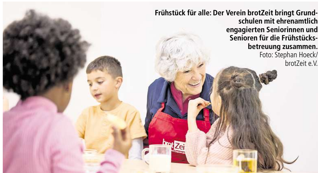
Frühstück für alle: Der Verein brotZeit bringt Grundschulen mit ehrenamtlich engagierten Seniorinnen und Senioren für die Frühstücksbetreuung zusammen.

Oberbürgermeister Belit Onay sieht darin einen direkten Beitrag zu mehr Bildungsgerechtigkeit. „Ein gesundes Frühstück ist eine wichtige Grundlage für erfolgreiches Lernen. Kinder, die hungrig in die Schule kommen, haben schlechtere Voraussetzungen, dem Unterricht zu folgen und ihr Potenzial zu entfalten. Deshalb unterstützen wir Angebote, die unmittelbar dort wirken, wo sie gebraucht werden – direkt an