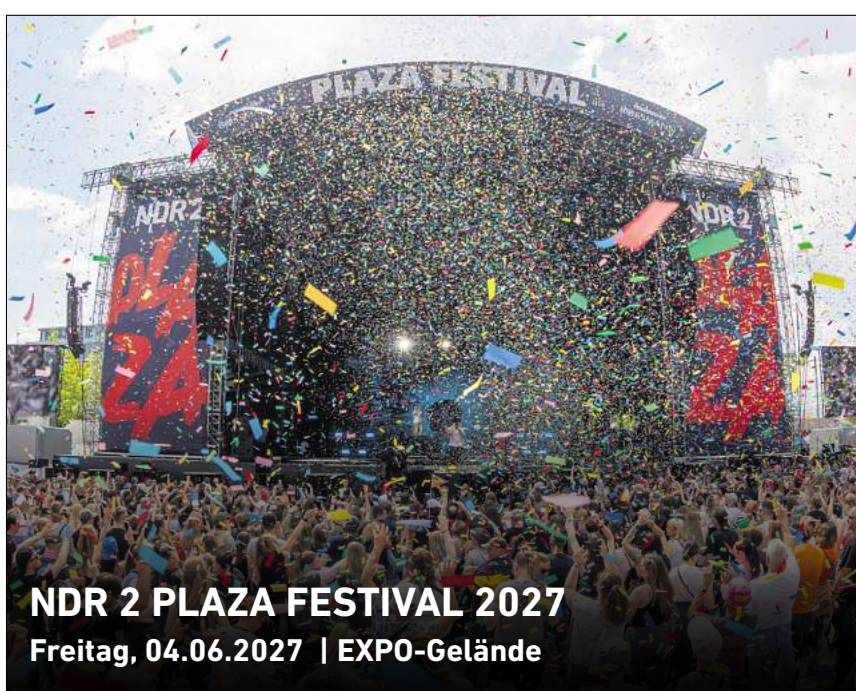
NDR 2 PLAZA FESTIVAL 2027 Freitag, 04.06.2027 | EXPO-Gelände