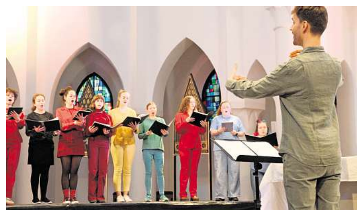
Der Kinder- und Jugendchor St. Joseph hat ein Musical geschrieben und bringt dieses Ende Juni auf die Bühne.

HANNOVER. Das Meer ist für viele Kinder ein Sehnsuchtsort: voller Tiere, Farben, Bewegung und Geheimnisse. Doch diese Welt ist bedroht. Plastikmüll, alte Netze und achtlos weggeworfener Abfall gefährden die Ozeane und ihre Bewohner. Genau darum geht es im Kindermusical „Dolphië - Ein fantastisches Singspiel des Meeres“. Ende Juni bringen der Kinderchor St. Joseph und der Kaleidoskop Jugendchor unter der Leitung von Johannes Hörnschemeyer dieses Thema auf die Bühne. Das Besondere daran: Die Geschichtchen haben die Kinder und Jugendlichen selbst geschrieben und für die Bühne entwickelt. Im Mittelpunkt steht das Fantasiewesen Dolphië. Es lebt im Meer, bis es eines Tages in ein altes Fischernetz gerät und sich nicht mehr befreien kann. Hilfe bekommt Dolphië von ihrer Freundin Flaschi. Gemeinsam machen sich die beiden auf den Weg in das fremde Land Plaknoto. Dort hoffen sie, eine Lösung zu finden, damit Dolphië das Netz loswerden und wieder frei