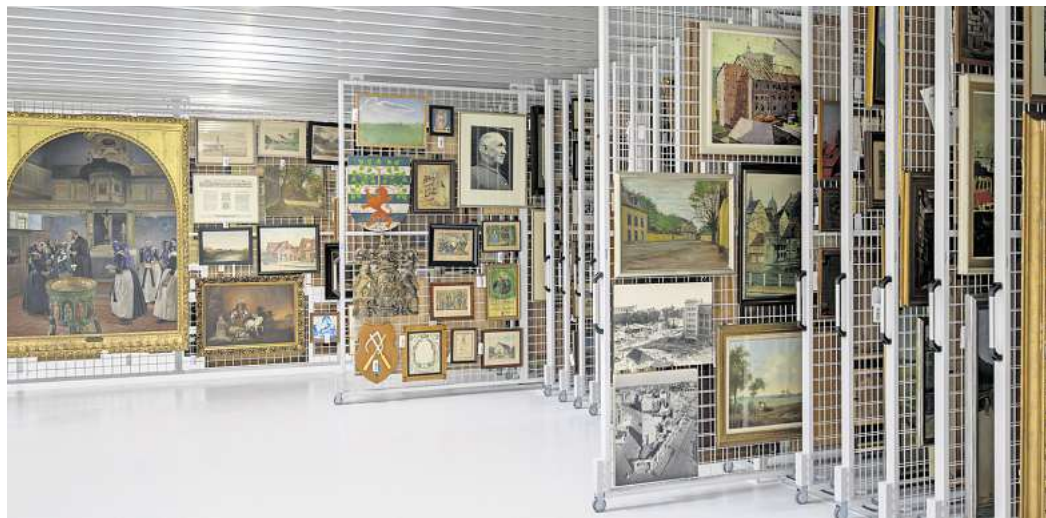
Reihenweise Bilder: Der städtische Kunstbesitz ist vollständig in das Sammlungszenrum gezogen.

werbetreibende. Für die letzten Bauphasen werden die Querungen für Fußgänger und Radfahrende am S-Bahnhof kurzfristig auf die östliche Brückenseite verlegt und ausgeschildert. Der Engelbosteler Damm bleibt dort aber weiter für den Individualverkehr gesperrt, da die Infra bereits mit Arbeiten für den neuen Hochbahnsteig Nordstadt begonnen hat. RED