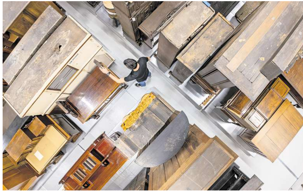
Das neue Sammlungszenrum vereint mehrere Hunderttausend Objekte der Museen für Kulturgeschichte, des Sprengel Museums Hannover und des städtischen Kunstbesitzes.

Die Stadtbibliothek bewahrt am neuen Standort wertvolle historische Bestände auf, darunter die Ratsbibliothek mit Wiegendruck aus dem 15.