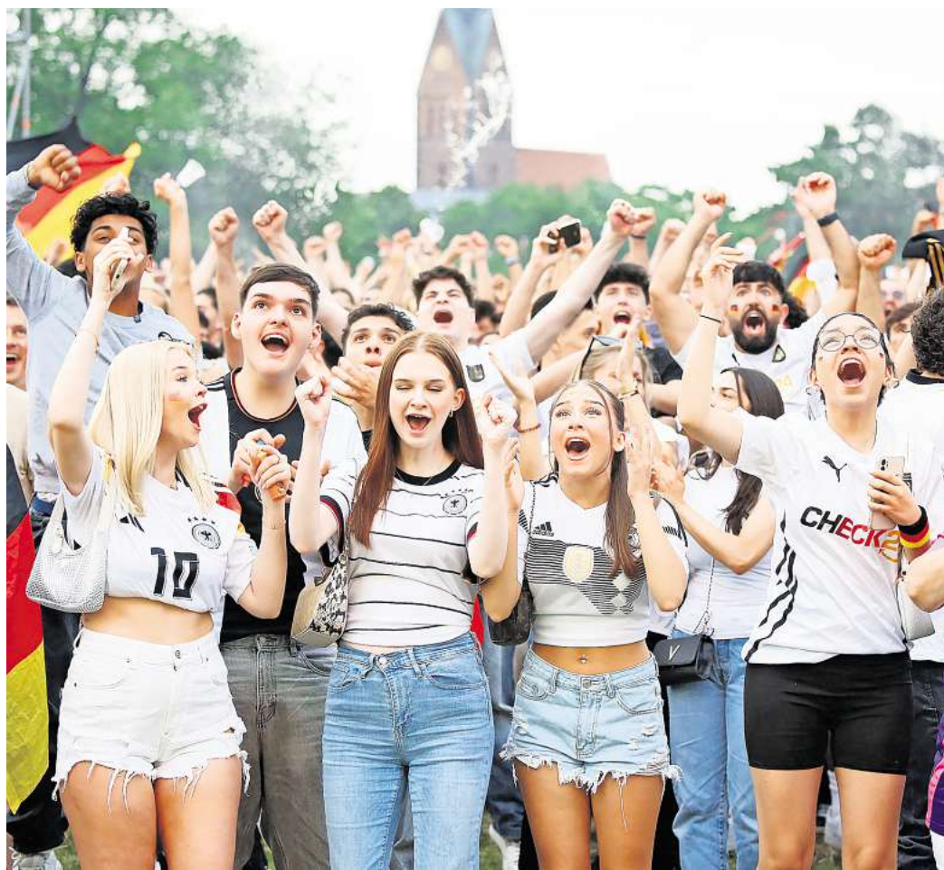
So soll es wieder sein: Ausgelassene Stimmung beim Public Viewing zum EM-Spiel Deutschland gegen Dänemark im Jahr 2024.

Das Public Viewing auf dem Waterlooplatz auszurichten, hat aus Sicht der Verantwortlichen eine ganze Reihe von Vorteilen. „Er ist gut erreichbar und bietet viel Platz. Die Veranstaltungen hier waren bereits in der Vergan-