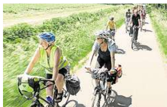
Beim Radwandertag kann man die Region auf einem Rundkurs erkunden.

Eine kleine Oase in der Stadt verspricht das reFLEX Sommerfestival , zu dem das Flex Ensemble und das Hölderlin Eins unter dem Motto „Oase“ einladen. Am Sonnabend, 13. Juni, von 16 bis 21 Uhr und am Sonntag, 14. Juni, von 11 bis 15 Uhr verwandelt sich das Hölderlin Eins, Hölderlinstraße 1, in einen offenen Konzertort ohne strenge Regeln. Sitzgelegenheit und Picknicktasche dürfen mitgebracht werden, der Eintritt ist frei, es gilt „Pay what you can“. Am Sonnabend beginnt das Festival um 16 Uhr mit einem Picknick-Konzert des Flex Ensembles mit Werken von Gabriel Fauré, Frank Bridge, Maurice Ravel, Paul Frenner, Libby Larsen und Caroline Shaw. Nach einem DJ-Set mit STOFF von Feinkost Lampe folgt um 19.30 Uhr das Dämmerungskonzert „Cosmic Calendar“ mit der Pianistin und Komponistin Marina Baranova. Am Sonntag geht es um 11 Uhr mit dem Familienkonzert „Es war einmal ... und wie geht es weiter?!“ weiter, einem Musikmärchen für