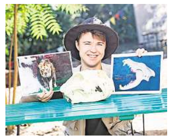
Zoo-Scouts vermitteln Wissen rund um Tiere.

Der Eintritt zum Familienfest ist im regulären Zooeintritt enthalten, Jahreskarten gelten ebenfalls. Einige Mitmachangebote werden gegen einen Selbstkostenbeitrag angeboten. RED