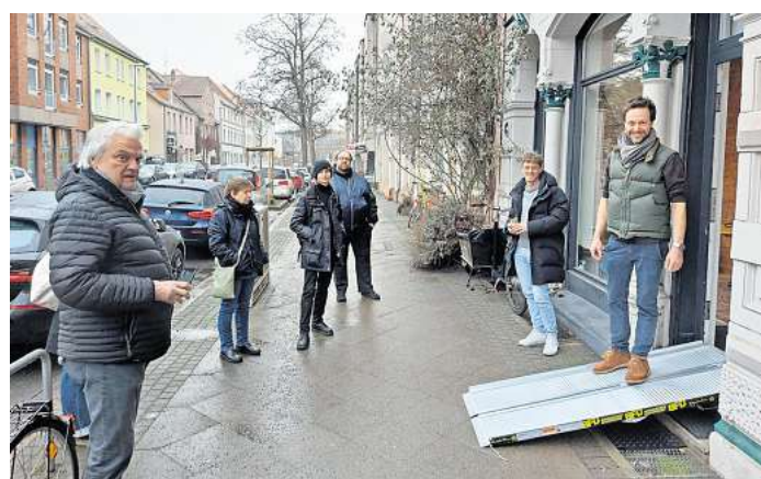
Die Rampen werden mit dem Fahrradanhänger ausgeliefert und ermöglichen einen barrierefreien Zugang zu Geschäften.

Hinter dem Projekt stehen der Verein Deisterkiez, die Lebenshilfe Hannover sowie das Quartiersmanagement der hanova WOHNEN GmbH. Gemeinsam stellen sie zehn weitere mobile Rampen sowie audiovisuelle Klingelsysteme zur Verfügung. Damit sollen insbesondere Menschen mit eingeschränkter Mobilität oder Sehbeeinträchtigungen leichter Zugang zu Geschäften erhalten. Die Teilnahme ist