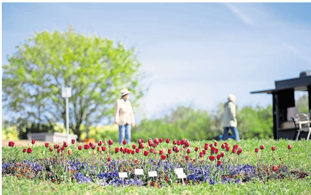
Da blüht was: Die Landesgartenschau läuft bis zum 18. Oktober 2026.

Das Ausstellungsgelände im historischen Kurpark ist von nun an jeden Tag zwischen 10 und 19 Uhr geöffnet. Eine Tageskarte kostet für Erwachsene 24 Euro, für Jugendliche und junge Erwachsene bis 24 Jahre 20 Euro sowie für Kinder ab drei Jahren einen Euro. Erstmals in Nieder-