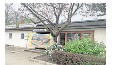
Die Gaststätte 11 A des VfL Eintracht wird grundlegend saniert.