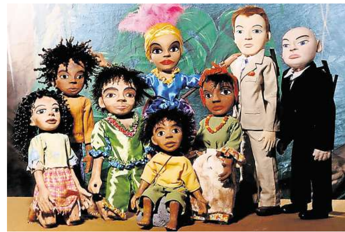
Im Theatrio: „Ricardo in Rio“ ist ein Stück des Figurentheaters Die Roten Finger.