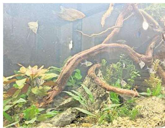
Fische im neuen Zuhause: Die Tiere haben sich nach dem Brand und dem Ausfall der Technik gut erholt.

haben, lag die Wassertemperatur bei nur drei Grad“, erklärt ein Mitarbeiter von Schreiber Aquaristik, der die Rettung und Pflege übernahm. Mit Ruhe, Futter und sorgfältiger Betreuung erholten sich die Tiere schrittweise.