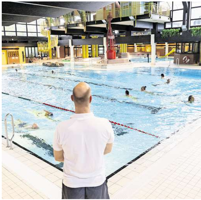
Könnten bald KI-Unterstützung bekommen: Die Aufsichtskräfte am Beckenrand des Vahrenwalder Bades.

In Hannover sind derzeit um die acht Stellen unbesetzt in den Bädern. Deutschlandweit sollen es rund 3000 sein. Viele in der Bäderbranche hoffen, dass KI auch gegen Fachkräftemangel helfen kann. Zwar werden weitere Aufsichtskräfte benötigt, um bei Notfällen Menschen vor dem Ertrinken zu retten. Nur sie können gefährdete Personen aus