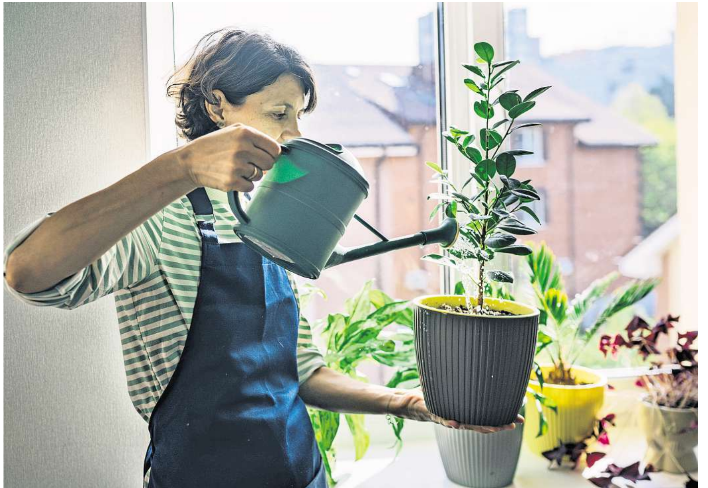
Häufigste Ursache fürs Absterben: Übermäßiges Gießen bekommt Zimmerpflanzen nicht gut – sie kommen mit kurzen Trockenphasen besser zurecht als mit ständig nasser Erde.

Neben der passgenauen Auswahl der Pflanze gibt es noch ein paar allgemeine Hinweise zur Pflege. Zu den häufigsten Todesursachen für Zimmerpflanzen gehört übermäßiges Gießen.