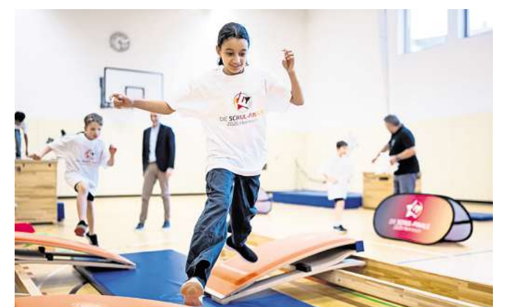
Die Schul-Finals sollen die Vielfalt der sportlichen Angebote und Lust auf Bewegung vermitteln.

Zu den Höhepunkten des Programms zählt der Auftakt am Donnerstag, 24. April, mit dem Beachvolleyball-Cup vor der Oper, den die Neue Presse als Medienpartner präsentiert. Am Montag, 4. Mai, folgt der Start für das 3x3-Basketball-Format in Burgdorf. Ein besonderer Fokus