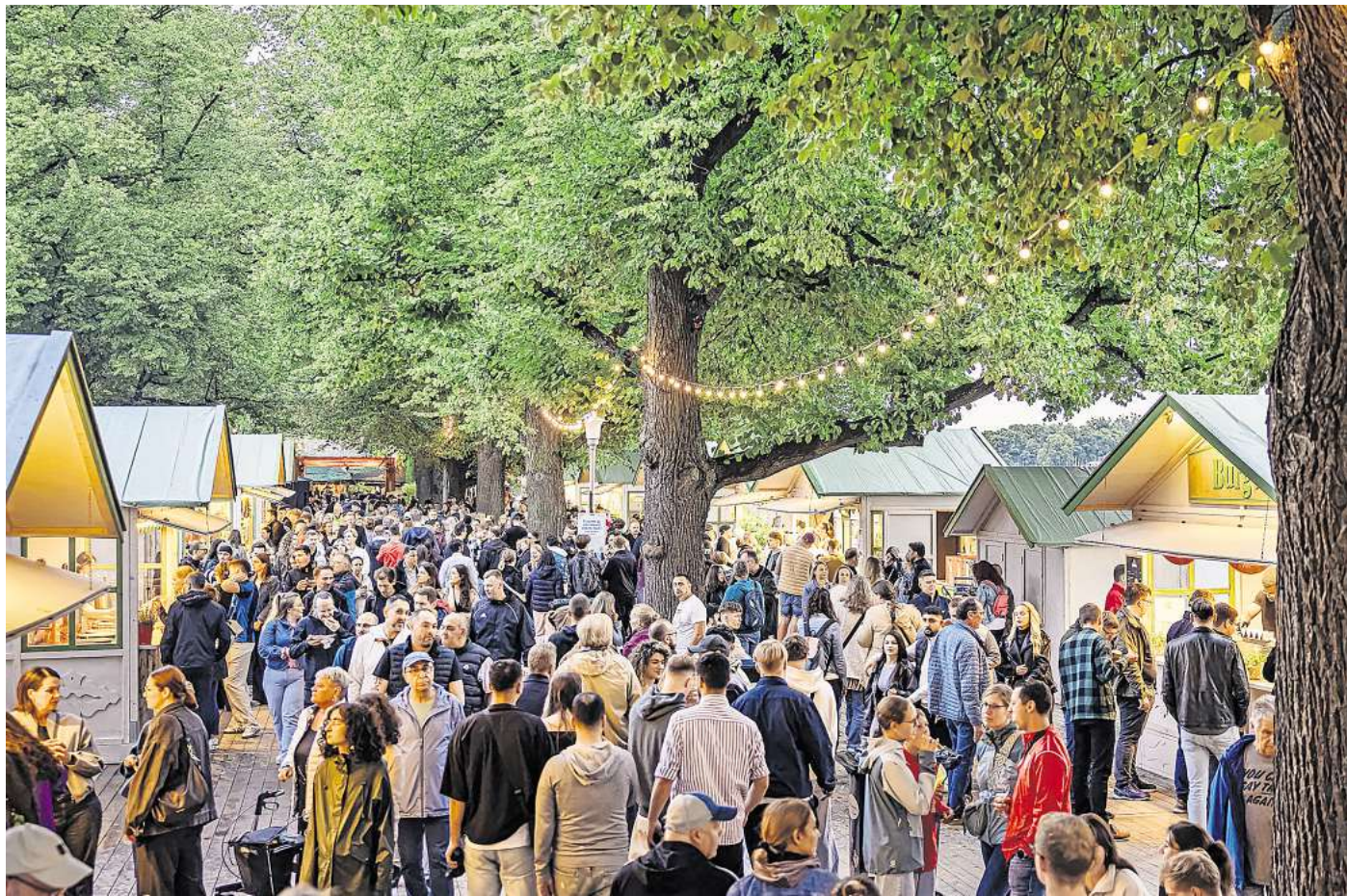
Anziehungspunkt beim Maschseefest: die Foodmeile.

Viele der beteiligten Betriebe arbeiten über mehrere Jahre hinweg an ihren Konzepten. „Das erste Jahr ist immer ein Learning – im zweiten und dritten Jahr werden die Erfahrungen genutzt, um Angebote gezielt zu