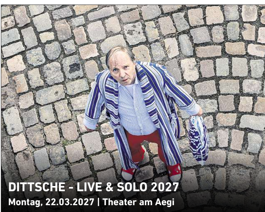
DITTSCHKE - LIVE & SOLO 2027 Montag, 22.03.2027 | Theater am Aegi

HANNOVER. Egal ob Zimmerpflanze, Kräuter oder Gartenpflanze: Ein Aktionstag rund ums Gärtnern findet am Sonntag, 19. April, im Freizeithaus Linden / Palettengarten Linden-Nord (PaGaLiNo), Windheimstraße 4, statt. Von 14 bis 17 Uhr gibt es eine Pflanzen- und Samentauschbörse. Gäste können Setzlinge, Ableger und Saatgut mitbringen und untereinander tauschen. Ergänzt wird das Angebot durch einen Workshop zur Herstellung von Pflanzenkohle, bei dem gezeigt wird, wie sich Boden verbessern lässt. Die Veranstaltung richtet sich an Interessierte ab acht Jahren und ist kostenfrei zugänglich, eine Anmeldung ist nicht erforderlich. RED