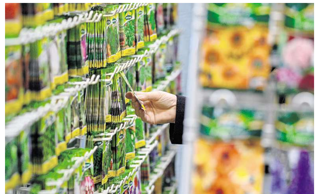
Die Verlockung ist groß, denn so ein Samentütchen ist klein und günstig.