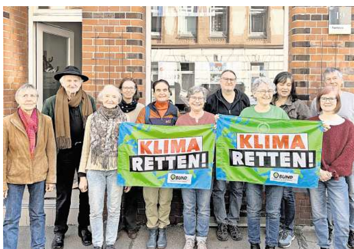
Das Klimabüro hat in Linden seinen neuen Standort bezogen.

tag von 14 bis 18 Uhr sowie Mittwoch von 10 bis 14 Uhr – soll mit dem neuen Angebot dauerhaft ein Ort entstehen, an dem Beratung, Austausch und praktische Unterstützung rund um den Klimaschutz in der Stadt Hannover gebündelt werden. RED