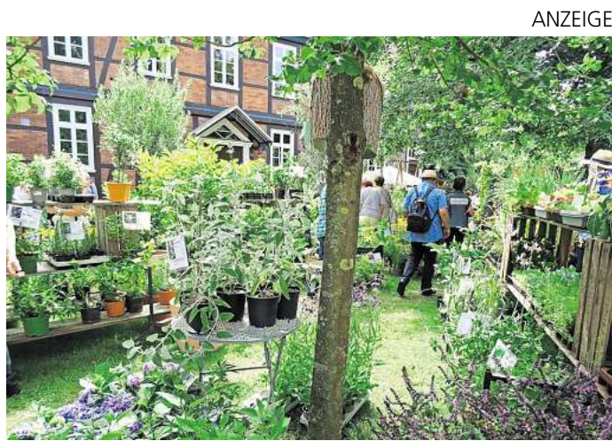
Das Gartenfestival Blumen & Ambiente findet in diesem Jahr vom 30. April bis zum 3. Mai statt.