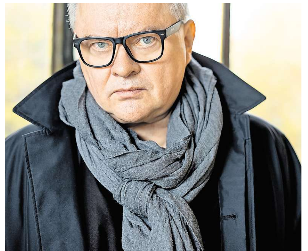
„Nie behauptet, modern zu sein“: Heinz Rudolf Kunze legt mit seinem neuem Buch „Gebrauchsgegenstand“ eine üppige Sammlung von Texten vor.

Das Cover von „Gebrauchsgegenstand“ ziert eine Handgrate in Gehirnform, was zusammen mit dem Titel suggeriert, dass es Kunze bange ist um den allgemeinen Zustand des Verstandes. Und ja, es geht, oft in scharfen Worten, um eine Art Volksverdummung, die für ihn aufgezogen zu sein scheint, um Erdkundelehrerinnen, die Ros-