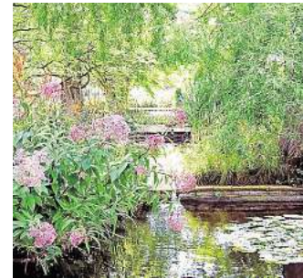
Die Touren im „Grünen Hannover“ führen zu den schönsten Ecken der Stadt, wie hier in den Stadtpark.