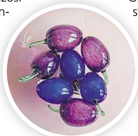
Exponate schwedischer Glaskunst aus dem Studio Bo