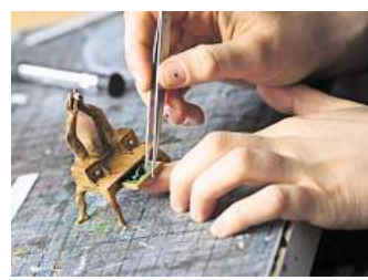
Abgründe: In der Schublade des Miniatur-Schminktisches haust das Monster von Loch Ness. Natürlich ein sehr kleines Exemplar.