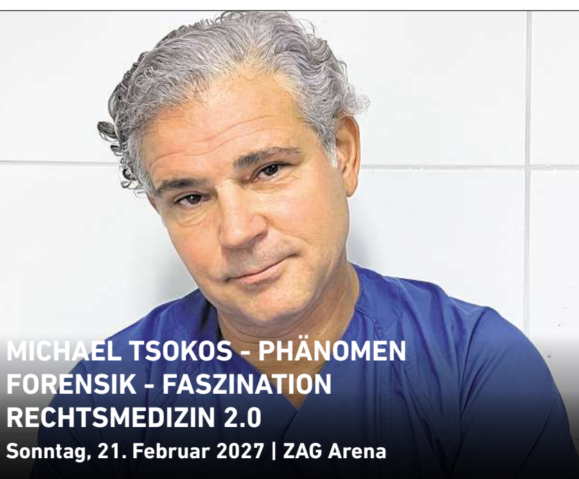
MICHAEL TSOKOS - PHÄNOMEN FORENSIK - FASZINATION RECHTSMEDIZIN 2.0 Sonntag, 21. Februar 2027 | ZAG Arena