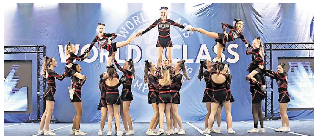
Die perfekte Vorstellung: Am ersten Wettkampftag erreichten die Volcanos Fire ein sogenanntes Hit Zero.

fen und unterstützt, wo es nur ging“, sagt Meyer. Für die Volcanos Fire war es der letzte Wettkampf in dieser Zusammensetzung, denn einige Cheerleaderinnen steigen ins nächste Level auf. Der Wettkampf war der perfekte Abschluss: „Das“, sagt Meyer, „wird keiner so schnell vergessen.“