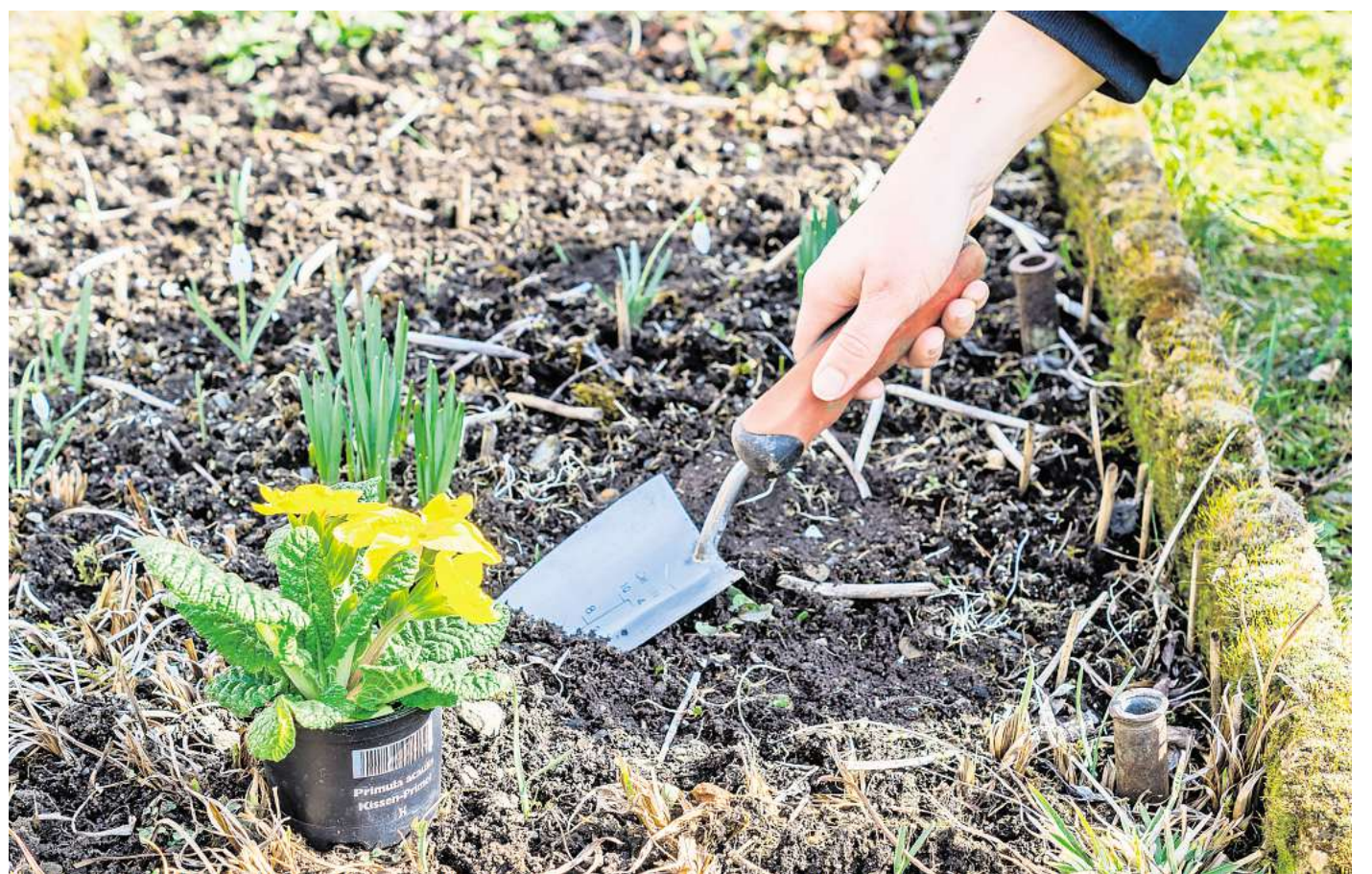
Nicht zu lange warten: Wer seine Primeln ins Freiland setzen möchte, sollte dies bereits nach der ersten Blüte tun.