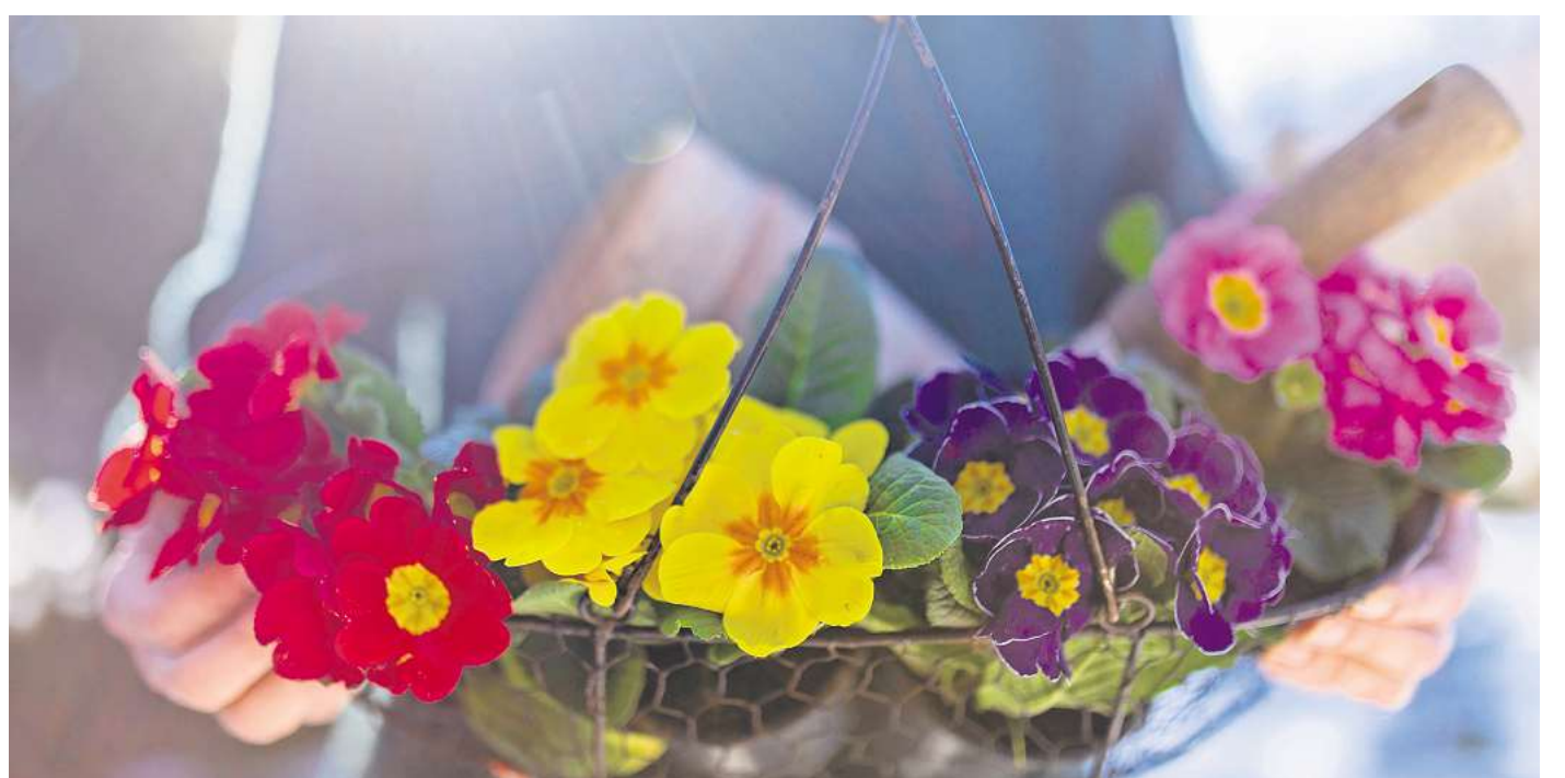
Farbenpracht: Primeln bringen den Frühling zum Leuchten – auch deshalb sind sie so beliebt.

Und was tun, wenn kein eigener Garten vorhanden ist, man der Kissen-Primel nach der Blüte aber eine zweite Chance geben möchte? Rudolph rät, die Pflanzen an Freunde oder Nachbarn mit Garten weiterzugeben. Wer einen Balkon besitzt, kann Primeln auch in Kästen oder Kübeln setzen und dort über das Jahr bringen. Bei passendem Standort und etwas Pflege stehen die Chancen gut, dass die Stauden im nächsten Frühjahr erneut blühen – und aus der vermeintlichen Wegwerfblume ein dauerhafter Frühlingsbote wird.