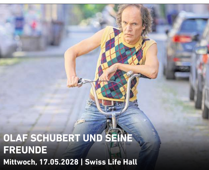
OLAF SCHUBERT UND SEINE FREUNDE Mittwoch, 17.05.2028 | Swiss Life Hall