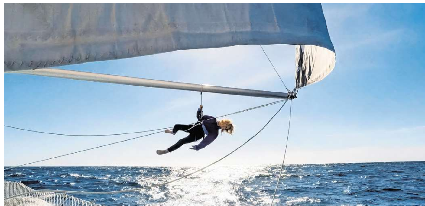
In „Home Is The Ocean“ geht es um das Familienleben auf einem Expeditionssegelboot.