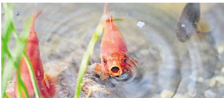
Ab 10 Grad: Teichfische werden erst aktiv, wenn das Wasser wärmer ist – kleine Futtermengen sind zum Saisonstart völlig ausreichend.

Ufer überprüfen: Auch das Teichumfeld sollten Gartenbesitzerinnen und -besitzer überprüfen. Im Winter können sich Folien, Steine oder Uferbefestigungen verschoben rund ums Wasser haben. Kleine Schäden lassen sich jetzt leicht beheben und verhindern spätere Probleme.