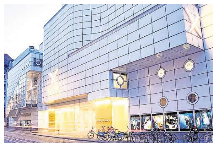
Das Schauspiel Hannover zeigt das Stück „Höhere Gewalt“ in deutschsprachiger Erstaufführung.

Die nächste Aufführung findet statt am Freitag, 27. März, von 19.30 bis 22.30 Uhr im Schauspielhaus, Prinzenstraße 9. Karten kosten zwischen 25 und 54,50 Euro, ermäßigte Tickets sind ab 5 Euro erhältlich. RED