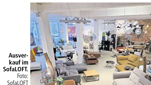
Ausverkauf im SofaLOFT.