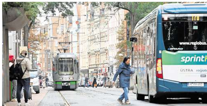
Bus und Bahn auf der Limmerstraße: „Wir wollen weitere Fahrgäste mit dem eTarif gewinnen.“