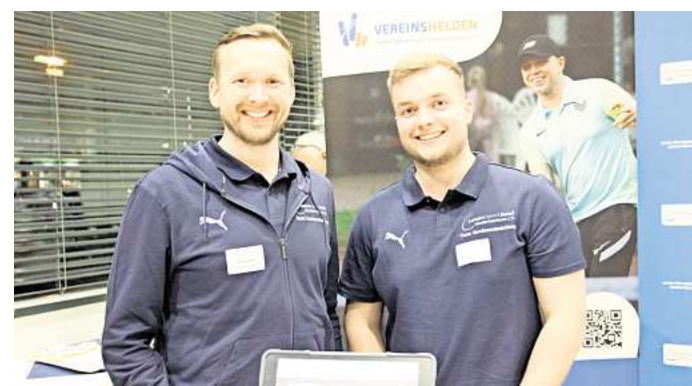
Auf dem Markt der Möglichkeiten beteiligten sich dieses Jahr acht Ausstellende, darunter auch ein Team des LandesSportBundes Niedersachsen.

Ergänzt wurde das Programm durch einen „Markt der Möglichkeiten“, auf dem sich Organisationen und Initiativen präsentierten und über Unterstützungsangebote informierten. Zum Abschluss verwies der Regionssportbund auf kommende Veranstaltungen und setzte damit den Ausblick auf weitere Impulse für die Vereinsarbeit fort. So stehen etwa vom 4. bis 6. April die „OsterAktivTage“ auf dem Programm und am 18. April das Pilotprojekt „Planspiel – Denk- & Spielraum für Nachhaltigkeit im Sportverein“.