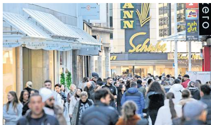
Viele Besucher kommen zum verkaufsoffenen Sonntag in Hannover.