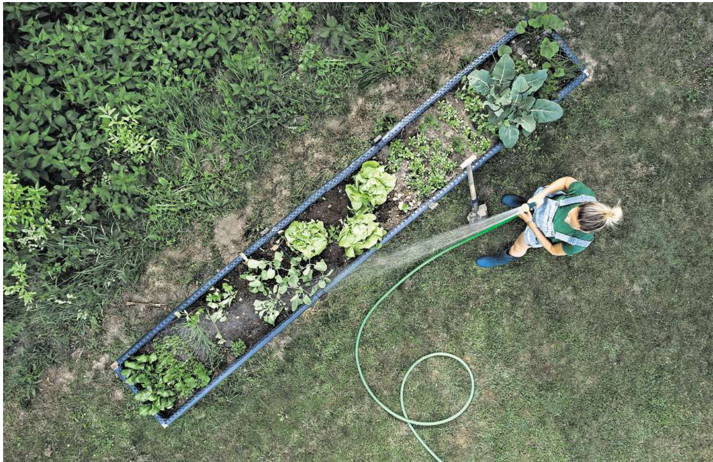
Wer seine Beete vorausschauend plant, wird im Sommer mit gesunden Pflanzen, reichen Erträgen und einer Extraportion gelebter Nachhaltigkeit belohnt.

Nicht alle Pflanzen verstehen sich gut – manche konkurrieren um Licht, Nährstoffe oder Wurzelraum. Eine durchdachte Mischkultur nutzt natürliche Synergien und kombiniert Pflanzen, die sich gegenseitig fördern. Gute Beetnachbarn sind beispielsweise Tomaten und Ba-