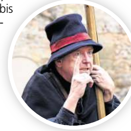
Melchior führt durch die Stadt und ihre Geschichte.

Tickets zum Preis von 15 Euro sind auf stattreisen-hannover.de online erhältlich.