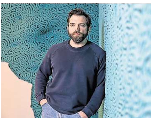
Der französische Künstler Jérémy Gobé stellt erstmals in Deutschland aus.