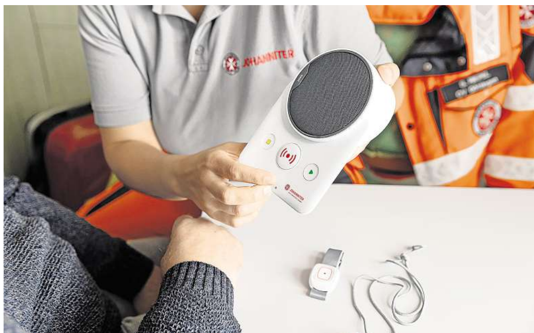
Eine Mitarbeiterin des Hausnotrufs zeigt einer Person die Bedienung des Geräts.

Auch das Ehepaar Moro aus Uetze bei Hannover war sich