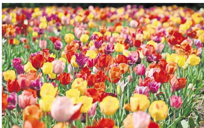
In einer hohen, schmalen Vase wachsen sie am besten: Tulpen.

Sie sind der Klassiker unter den Winterblumen – bereits zum Jahresbeginn gibt es Tulpen überall zu kaufen. In einer hohen, schmalen Vase wachsen sie am besten, erläutern die Fachleute. Nach dem Kauf lässt man sie am besten kurz im Papier ruhen. Tulpen brauchen nur eine kleine Schicht Wasser und in den ersten Stunden keine Schnittblumennahrung.