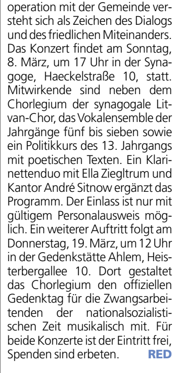
Chorlegium