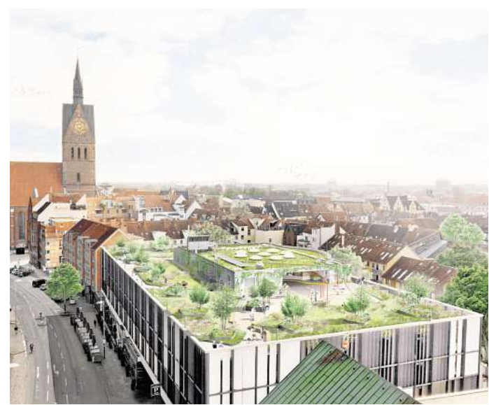
Grüne Aufenthaltsbereiche auf den Dächern der Stadt: So soll es später aussehen. Visualisierung: Rehwaldt Landschaftsarchitekten

Die „City Roofwalks“ reagieren auf zentrale Herausforderungen moderner Städte. Hohe Versiegelungsgrade, zunehmende Hitzeperioden und vermehrte Starkregenereignisse stellen Kommunen vor wachsende Aufgaben. Begrünte Dächer können zur Abkühlung beitragen, Regenwasser zwischenspeichern und zeitverzögert abgeben. Dadurch wird die Kanalisation entlastet und das Mikroklima verbessert. Zugleich entstehen zusätzliche Aufenthaltsflächen, die neue Perspektiven auf die Innenstadt eröffnen und Stadtleben auf einer weiteren Ebene ermöglichen. In der aktuellen Bauphase entstehen rund