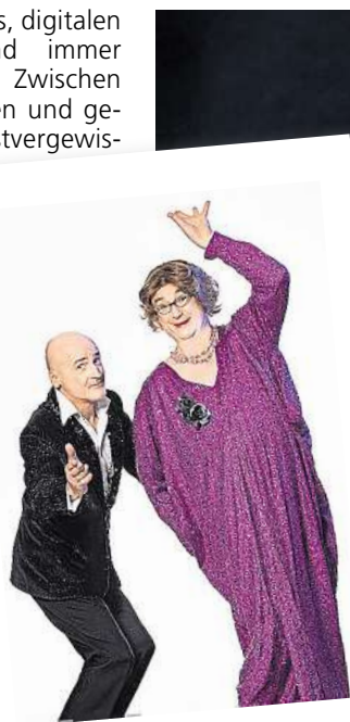
Bühnen-Geburtstag mit „garstigen Liedern“: Emmi & Willnowsky

Mit „JA SORRY!“ ist Timo Wopp am Dienstag, 17. März, ab 20.15 Uhr im Apollo zu Gast. In seiner Zusatzshow bewegt sich der preisgekrönte Stand-up-Comedian zwischen Selbstironie und gesellschaftlicher Analyse. Er nimmt eigene Widersprüche ebenso ins Visier wie aktuelle Debatten und lotet