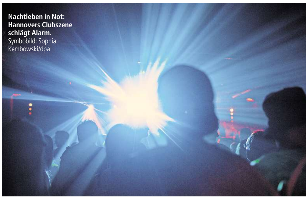
Nachtleben in Not: Hannovers Clubszene schlägt Alarm.

Eine zentrale Frage in der politischen Debatte: Was ist ein Club? Ein Kulturort? Ein sozio-