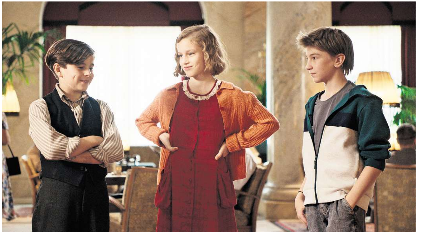
Szene aus „Das geheime Stockwerk“.

Viele weitere, spannende Neuigkeiten aus der lokalen Kulturszene finden Sie in der aktuellen Ausgabe unseres Partnermediums magaScene, monatlich frisch gedruckt und kostenlos an über 500 Auslegestellen in Hannover oder online auf www.magaScene.de inklusive Download-Möglichkeit.