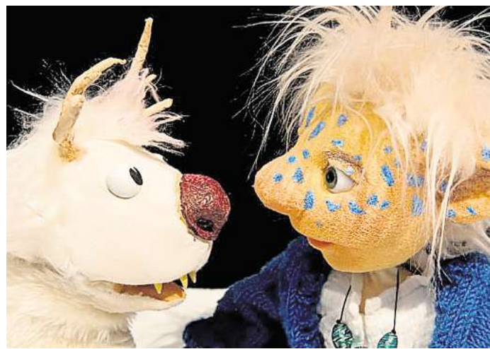
Das Figurentheater Buchfink zeigt „Lykke Eira“.