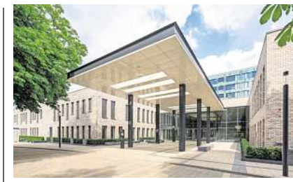
ANZEIGE Das Klinikum Region Hannover blickt auf eine langjährige Erfahrung in der Behandlung von Krebserkrankungen zurück.

Beim Land setzt die Region sich dafür ein, aus dem Modellprojekt ein Regelangebot zu ma-