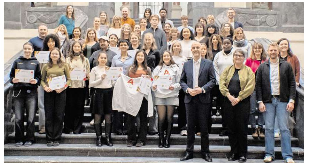
Die neuen Antidiskriminierungs-Teams mit Oberbürgermeister Belit Onay sowie Sozial- und Integrationsdezernentin Sylvia Bruns auf der Treppe in der Halle des Neuen Rathauses.

Ziel bleibt es, jungen Menschen einen niedrigschwelligen Zugang zu Unterstützung vor Ort zu ermöglichen und Diskriminierung im schulischen und studentischen Alltag frühzeitig zu thematisieren. Mit den neu zertifizierten A-Teams soll dieses Angebot in Hannover weiter ausgebaut und dauerhaft verankert werden.