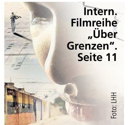
Intern. Filmreihe „Über Grenzen“. Seite 11