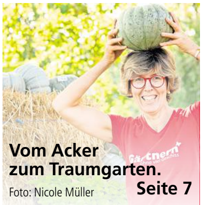
Vom Acker zum Traumgarten. Seite 7