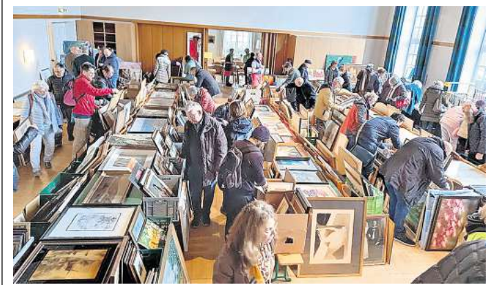
Am 28. Februar und am 1. März findet im Gemeindehaus der Bugenhagenkirche der „Sturm auf Schmuck und Bilder“ statt.