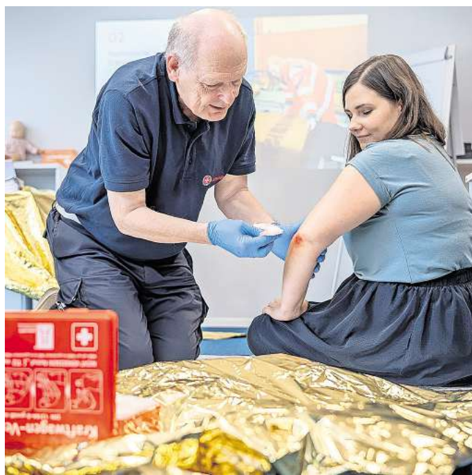
Ein Erste Hilfe-Trainer zeigt am Beispiel einer Teilnehmerin in einem Erste Hilfe-Kurs, wie man einen Verband am Ellenbogen anlegt. Das verwendete Material stammt aus einem Verbandkasten der Johanniter Unfall-Hilfe e.V.

In diesem Jahr werden die Johanniter in Hannover vier der insgesamt sieben Module des Konzeptes „Erste Hilfe mit Selbstschutzinhalten“ anbieten. Die einzelnen Module werden differenziert nach Bevölkerungsgruppen. „Inhaltlich geht es darum, die praktische Fähigkeit der Bevölkerung zur Selbst- und Fremdhilfe in außergewöhnlichen Notlagen zu steigern“, sagt Sabrina Kirchner, die den Bereich Breitenausbildung