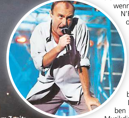
Auf dem Zenit: Phil Collins 1994 bei einem seiner Konzerte im Niedersachsenstadion.

Weltrekord für Stadionshows – und ist für Hannover bis heute die Bestmarke. Auch wenn AC/DC, Guns N'Roses, Eminem oder Ed Sheeran auf dem Messegelände bei Einzelkonzerten jeweils 70.000 oder mehr Fans zusammenbrachten.