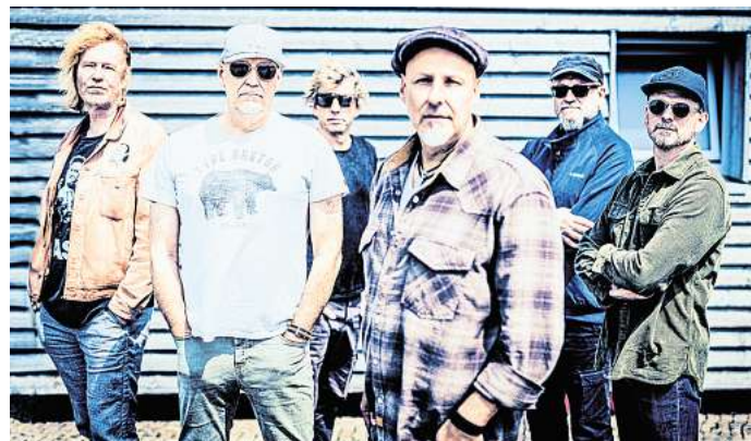
Immer für volle Hallen gut: Fury in the Slaughterhouse.

fähig – und der Bereitschaft der Veranstalter, auf Newcomer zu setzen, sicher nicht förderlich.