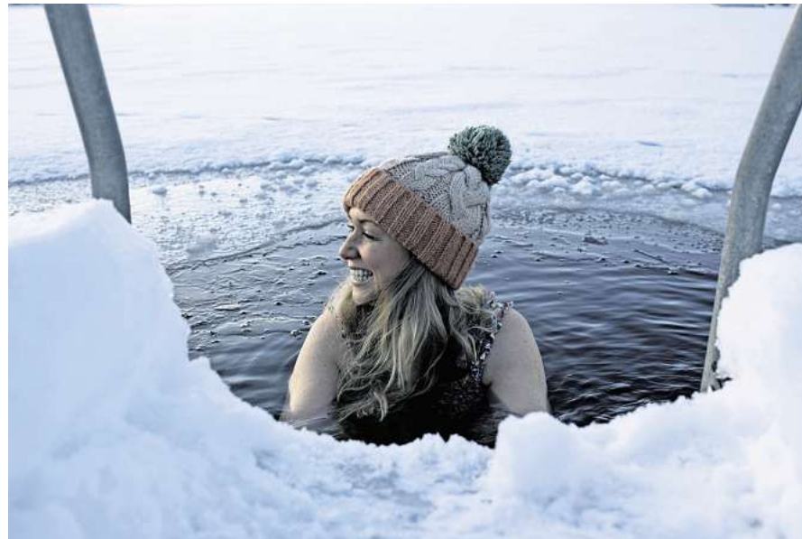
Über den Moment hinaus: Wer regelmäßig ins eisige Wasser eintaucht, verbessert seinen Schlaf und senkt das Stressempfinden – ein Plus für die Lebensqualität.

Eisbaden ist also deutlich mehr als ein kurzfristiger Kick. Viele