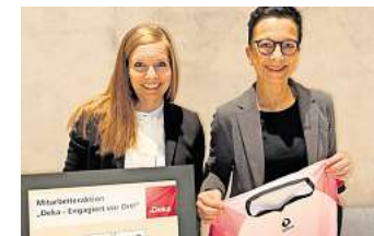
Die Pinke Zitronen e.V. sind eine Selbsthilfegruppe für jüngere Frauen und Mütter mit Brustkrebs.

Pinke Zitronen e.V. ist eine Selbsthilfegruppe für jüngere