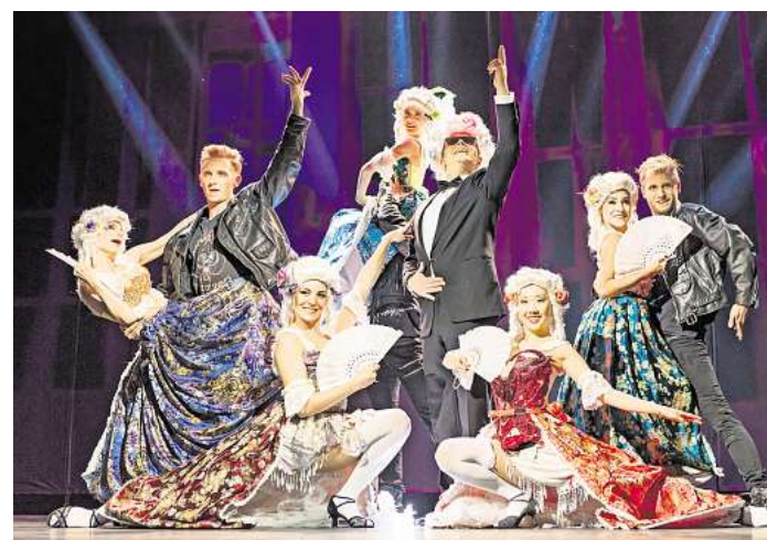
FALCO MEETS AMADEUS kommt am 5. und 6. April ins Theater am Aegi nach Hannover.

Die Produktion geht einen ungewöhnlichen Weg: Wolfgang Amadeus Mozart erscheint Falco als geistige Vorstellung, begleitet ihn durch Höhen und Tiefen seiner Karriere. „Versuch's doch mal mit einem Kinderlied“, flüstert die Vision – und tatsächlich wird „Rock Me Amadeus“ zum Wendepunkt. Der Song kapituliert Falco 1986 als ersten und einzigen Künstler mit einem komplett deutschsprachigen Song an die Spitze der US-