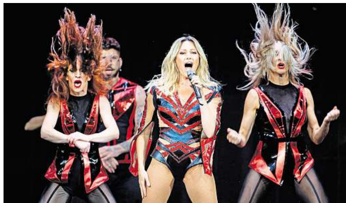
Im Rausch: Helene Fischer 2023 auf der Bühne der ZAG Arena.

Der Mannheimer hat mit seinem Viererpack schon das Zuschauerpotenzial fürs Stadion, aber eine Tour im Januar ist dann in der Halle doch wärmer für alle. Wenn er in einem der nächsten Sommer wiederkommen sollte, dürfte die Hütte voll werden. Er wäre übrigens der erste Rapper, der das 96-Stadion ausverkauft.