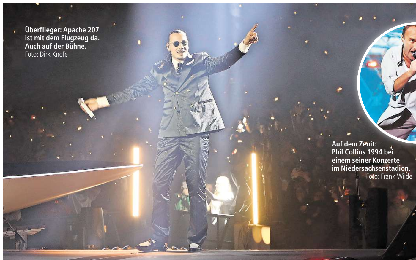
Überflieger: Apache 207 ist mit dem Flugzeug da. Auch auf der Bühne.

Und an dieser Stelle zeigt sich die Kehrseite des Live-Booms, denn die Zahlen werden vor allem von großen Künstlern getrieben, die meisten Veranstaltungen sind jedoch klein: 91 Prozent der rund 250.000 Konzerte im Jahr 2024 gingen laut der Verwertungsgesellschaft Gema in Läden mit maximal 500 Plätzen über die Bühne – mit einer Durchschnittsauslastung von 122 Fans. Das ist wirtschaftlich in den meisten Fällen nicht trag-