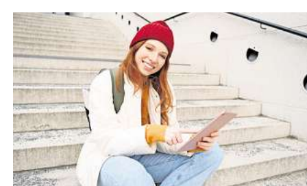
Studierende am DIPLOMA Studienzentrum Hannover zahlen in der Regel keine Studiengebühren.

Auch interessierte Praxispartner sind herzlich eingeladen, um mehr über Kooperationsmöglichkeiten zu erfahren. Weitere Informationen unter www.diploma.de . DIPLOMA Studienzentrum Hannover Wilhelmstraße 2 30171 Hannover Telefon: (0511) 844 894 89 E-Mail: hannover@diploma.de