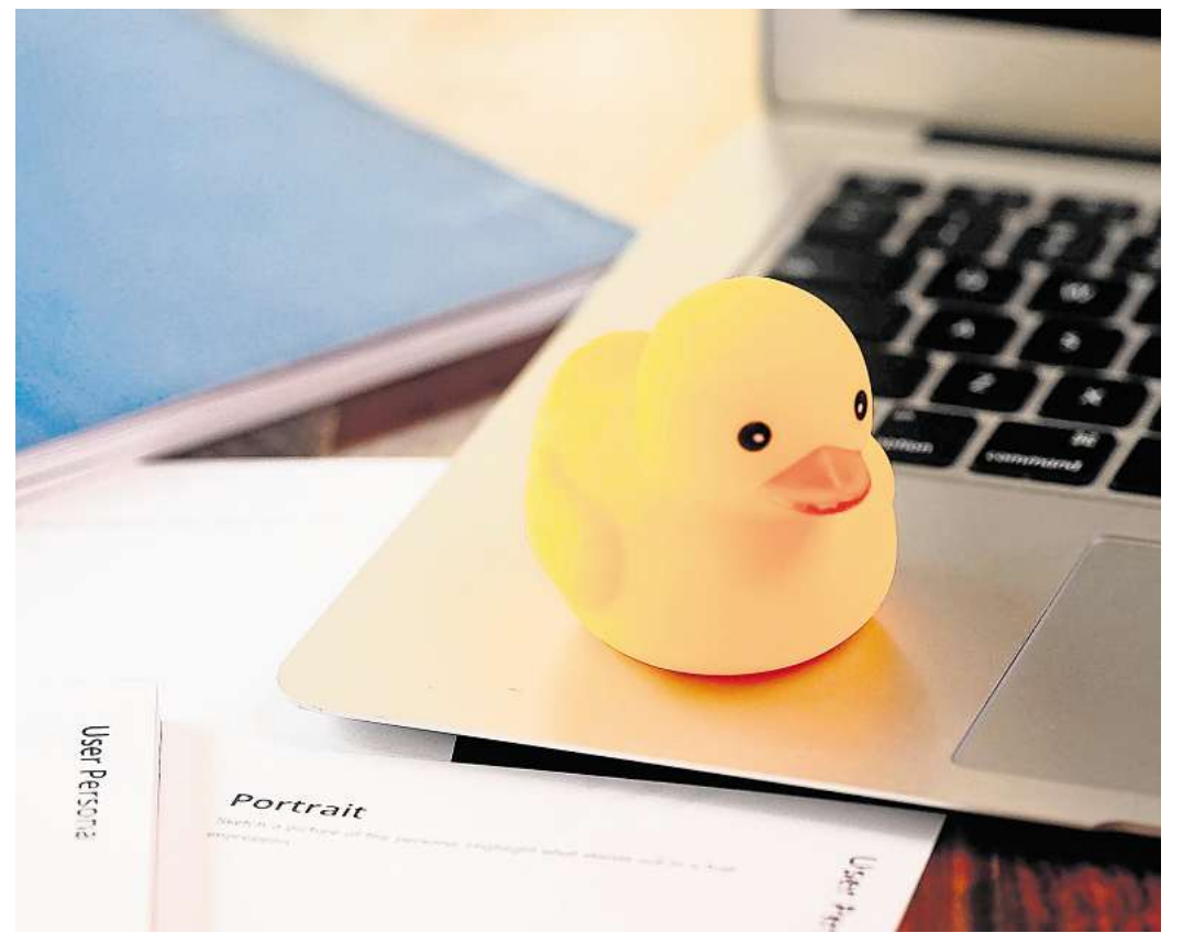
Softwareentwickler verwenden das „Rubber-Duck-Debugging“, um Fehler im Code zu finden.

Das liegt daran, dass das Lehren zwingt, komplexe Inhalte in kleinere Bausteine zu zerlegen, mit vorhandenem Wissen zu verknüpfen und in logische Bahnen zu bringen. Auch die Strategie des „Self-Explaining“, also sich selbst etwas laut zu erklären, gilt