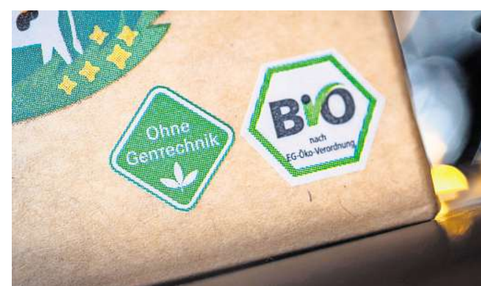
Das Siegel „Ohne Gentechnik“ gibt es seit 2009; auch Bio-Lebensmittel müssen „ohne“ sein.

Alle Nutzpflanzen müssen gekennzeichnet werden, wenn sie gentechnisch verändert sind – das ist eine EU-weite Regel. In der EU selbst werden solche Pflanzen bis auf Mais gar nicht angebaut, aber importiert. Lebensmittel, Zutaten, Zusatzstoffe und Aromen müssen immer