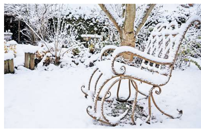
Garten im Winter: Ein Ort des Sich-Zurücknehmens.

In der chinesischen Philosophie des Daoismus beschreibt der Begriff Wu Wei das „Nicht-Handeln“, das jedoch kein passives Unterlassen meint. Es geht vielmehr um das Handeln im Einklang mit dem natürlichen Lauf der Dinge – ein Tun ohne Zwang, ein Wirken ohne forcierten Eingriff. Übertragen auf den Garten heißt das: den eigenen Gestal-