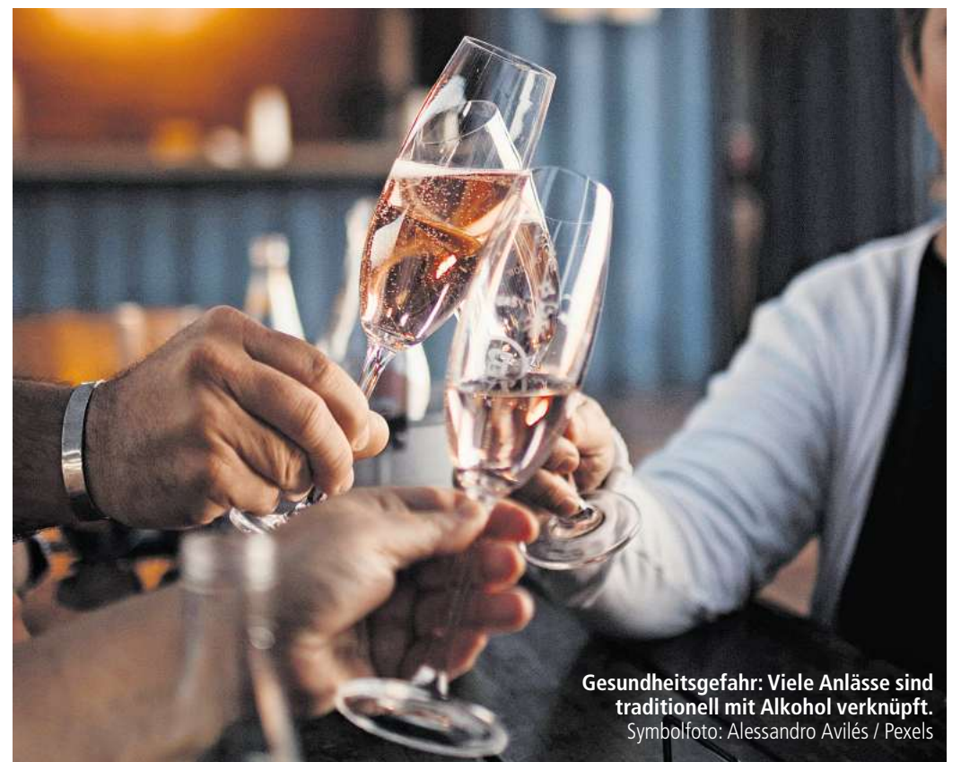
Gesundheitsgefahr: Viele Anlässe sind traditionell mit Alkohol verknüpft.

Gut zu wissen: Suchtberatungsstellen stehen nicht nur Betroffenen offen, sondern auch ihren Angehörigen. Die Deutsche Hauptstelle für Suchtfragen (DHS) bietet eine Online-Suche an, über die man Hilfsangebote in der Nähe des Wohnorts finden kann.