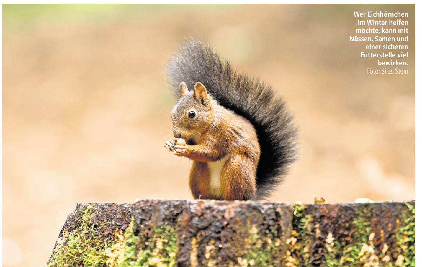
Wer Eichhörnchen im Winter helfen möchte, kann mit Nüssen, Samen und einer sicheren Futterstelle viel bewirken.

Als Dekopflanze ist Eukalyptus längst etabliert – ob im Kranz, im Strauß oder als einzelner Zweig in der Vase. Doch seine Wirkung reicht weit darüber hinaus. Die Blätter enthalten ätherisches Eukalyptusöl, das schleimlösend, antibakteriell und wohltuend für die Atemwege wirkt. Viele kennen den Duft aus Erkältungsbädern oder Hustenbonbons. Die Zweige lassen sich ähnlichwie Kräuter trocknen: kopfüber an einem luftigen, schattigen Ort oder schneller im Dörrautomaten. Vor der Verwendung von Eukalyptus sollte man aufgrund möglicher abschwächender Wirkung von Medikamenten sicherheitshalber mit seinem Arzt sprechen.