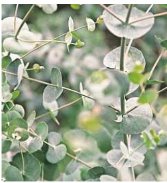
Wer Eukalyptus pflanzt, sollte bedenken, dass auch das Wurzelwerk viel Platz beansprucht.

Die beste Pflanzzeit ist im Frühsommer, nach den Eisheiligen. Wichtig dabei: Eukalyptus wächst für gewöhnlich in der pralsten Sonne Neuseelands oder Australiens, daher braucht er einen sonnigen Standort. Gleichzeitig mag er es luftig, aber nicht zugig. Der Boden sollte durchlässig, nährstoffreich und leicht sauer sein, ideal ist ein pH-Wert zwischen 5,5 und 6. In besonders schwerem Boden am besten etwas Sand oder Kom-