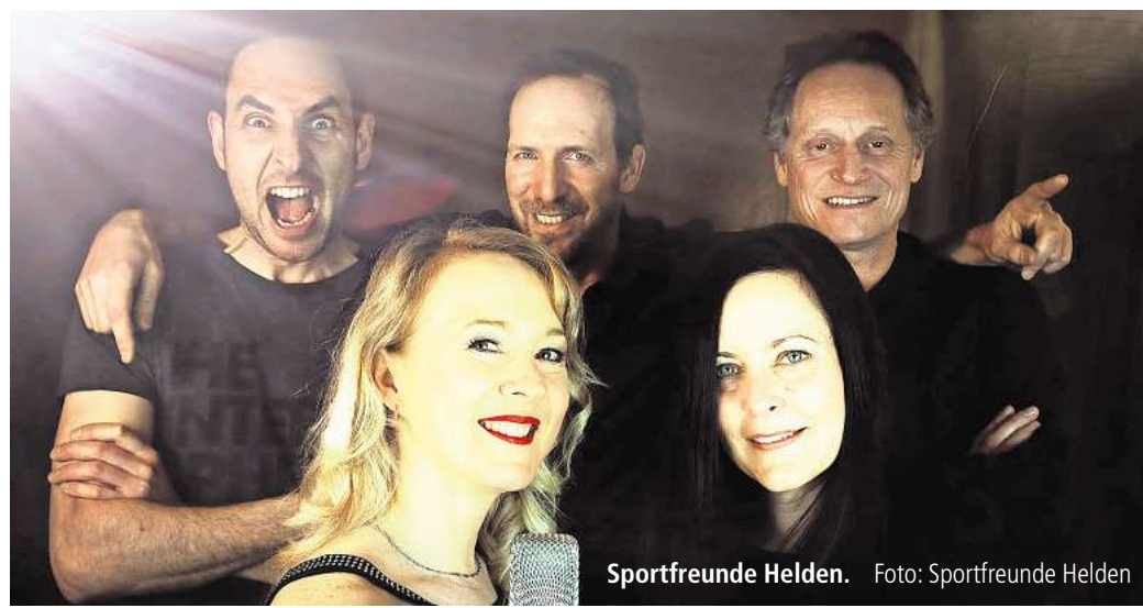
Sportfreunde Helden.

Viele weitere, spannende Neuigkeiten aus der lokalen Kulturszene finden Sie in der aktuellen Ausgabe unseres Partnermediums magaScene , monatlich frisch gedruckt und kostenlos an über 500 Auslegestellen in Hannover oder online auf www.magaScene.de inklusive Download-Möglichkeit.