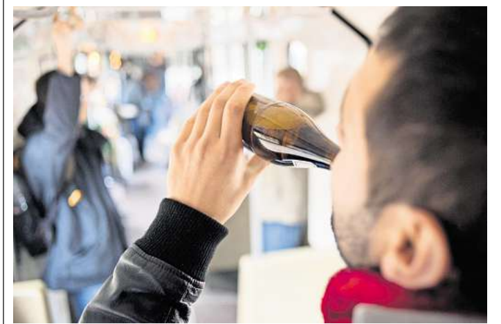
Seit 2017 verboten: Alkohol trinken in der Stadtbahn.

Außerdem die Sanierung der Radwege auf der Ostseite der Leine am Fuße des Bremer Damms oder die Umgestaltung der Culemannstraße als wichtige Radwegverbindung vom Maschsee in die Innenstadt. Einsteigen möchte die Verwaltung auch in die konkreten Planungen für ein Fahrradparkhaus im ehemaligen Tiefbunker unter dem Hauptbahnhof.