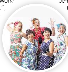
„Herzen in Terzen“

HANNOVER. Eine halbstündige Klangperformance zum Thema „Nacht“ ist am Sonnabend, 10. Januar, im Pavillon, „workshop hannover e. V.“, Lister Meile 4 zu erleben. Das Ensemble KIMO-NO mit Holger Kirleis und Jürgen Morgenstern präsentiert die Arbeit um 18 Uhr, 19 Uhr und 20 Uhr, der Einlass beginnt jeweils 15 Minuten vorher. Zu hören ist ein im Raum verteilter Klangverlauf für acht Lautsprecher und zwei Musiker. Kontrabass, Blasharmonika, Toy piano und weitere Klangobjekte entfalten sich im Zusammenspiel mit räumlich angeordneten Lautsprechern. Die Komposition greift Lauter nächtlicher Tiere ebenso auf wie Geräusche nächtlicher Arbeit, etwa aus Reinigungsdienst und Bäckereibetrieb. Die Performance ist als musikalisches Nachdenken