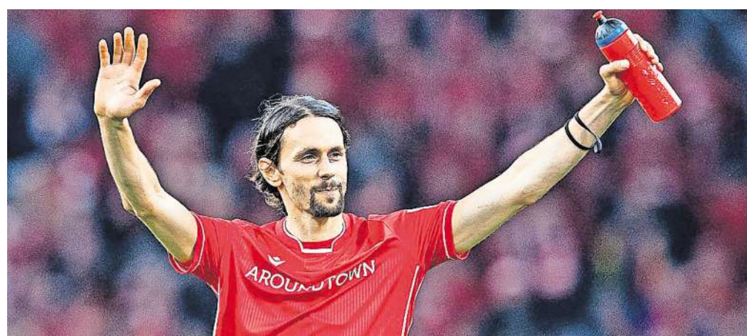
Im Union-Trikot: Neven Subotic wurde nicht nur in Dortmund, sondern auch in Berlin von den Fans gefeiert