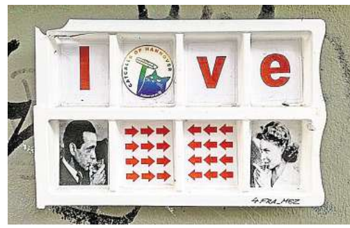
Street-Art in Linden: Kunst von 4FRA_MEZ

im Gespräch mit sich selbst ist, voller Zeichen, Kommentare und visueller Experimente. Bornscheuer ordnet diese Fragmente neu, stellt Bezüge her und schafft aus dem flüchtigen Nebeneinander eine kuratierte Erzählung. So entsteht ein bunter, dicht gepackter Blick auf eine Szene, die sich laufend verändert. Zu sehen ist die Ausstellung noch bis zum 18. April im Freizeitheim Linden, Windheimstraße 4. Die Öffnungszeiten sind werktags von 9 bis 21.30 Uhr, am Wochenende von 10 bis 17.30 Uhr. Der Eintritt ist frei. RED