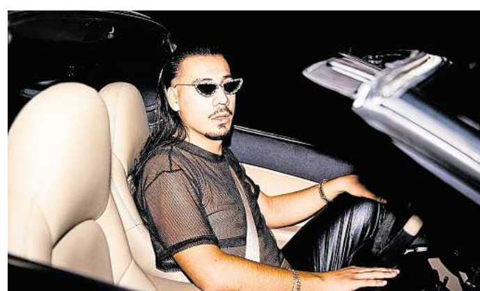
Rapper im Netzhemd: Für ein solches Outfit wäre Bushido wohl verspottet worden – doch Apache 207 definiert Coolness neu.

Zum Ende eines Sommer voller Festivalauftritte hat Serpentin (Jo-