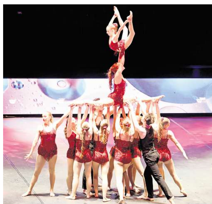
Heimliche Gewinner des Abends: Die jungen Athletinnen und Athleten der Sportakrobatik-Showgruppe des MTV Ilten verzauern die Zuschauer.

ration ein gutes Vorbild sein kann“, sagte der viermalige Olympia-Starter, der vor Aufregung kurz das Gerät verlassen musste, für die gelungene Übung im zweiten Anlauf aber gefeiert wurde. Das Viva-Programm ist auch der Abschluss