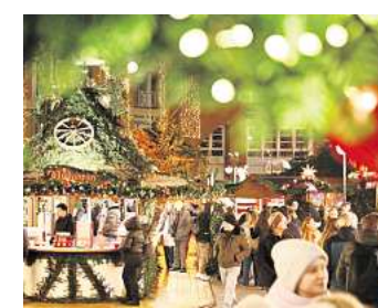
Hannovers Weihnachtsmarkt

Wer als Gruppe auf den Weihnachtsmarkt geht, braucht Stände, die ausreichend Platz für alle bieten und im besten Fall auch noch überdacht sind. Getränkestände, die beides bieten, sind „Bä(h)renstark“ zwischen der Marktkirche und dem Alten Rathaus, das Finnische Dorf, die „Zauber Taverne“ und der Stand „Zur wilden Kirsche“ an der Leinpromenade sowie die „Brauhaus Hütte“ am Weihnachtsbaum. Dort kommen auch herzhaftes Speisen auf die Tische. Wer auch mal eine Runde ausgeben möchte, sollte beachten, dass auf dem Weihnachtsmarkt nicht