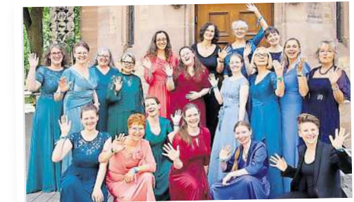
Der Frauenchor Hannover tritt in der Gartenkirche St. Marien auf.

► Der Norddeutsche Figuralchor singt am Sonnabend, 13. Dezember, ab 20 Uhr begleitet von Musica Alta Ripa ein Adventskonzert in der Marktkirche, Hanns-Lilje-Platz. Karten kosten 8 bis 45 Euro und sind im Vor-