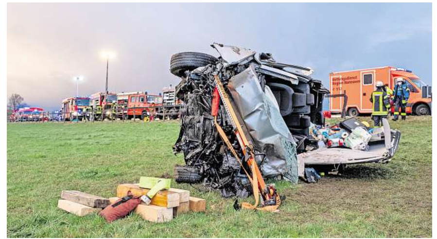
Schreckliche Tragödie: Auf der Kirchdorfer Rehr starben 2022 ein Zweijähriger und sein sechsjähriger Bruder nach einem schweren Unfall. Der Auslöser war ein illegales Autorennen.