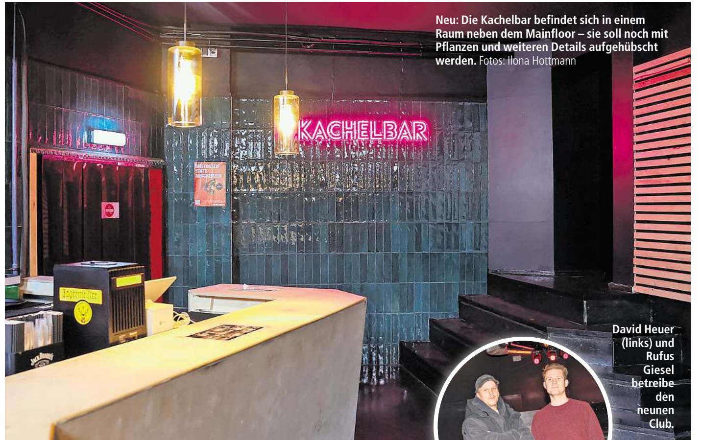
Neu: Die Kachelbar befindet sich in einem Raum neben dem Mainfloor – sie soll noch mit Pflanzen und weiteren Details aufgehübscht werden.

2019 verkaufte Gründer Sem Köksal (49) den Club. Sein Nachfolger Philipp „Friso“ Hoeksma versuchte, mit einem neuen Konzept an die legendären „Welspiele“ anzuknüpfen, die in den 1990er-Jahren in einem ehemaligen Kino an der Georg-