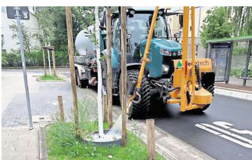
Einer der acht Bewässerungstraktoren der Stadt im Einsatz.

Im Straßenraum gehen zunehmend Pflanzmöglichkeiten verloren, da immer mehr Flächen durch Leitungen, Zufahrten oder Rettungswege blockiert sind. Gleichzeitig führen