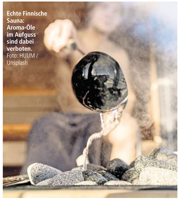
Echte Finnische Sauna: Aroma-Öle im Aufguss sind dabei verboten.

Ja, die finnische Sauna ist etwas sehr Demokratisches. Ein fester Stundenplan für einen Aufguss, wie es in Deutschland gibt, wäre in Finnland undenkbar, genauso wie die Sanduhr an der Wand. Oder dass man sich ein verrückt großes Handtuch mitbringen muss, auf dem man sitzt. Solche starren Regeln gibt es hier nicht. Während in Finnland einfach alle in der Sauna sitzen und sich entspannen, tritt in Deutschland ein sogenannter Saunameister in die Mitte und zieht die ganze Aufmerksamkeit auf sich. In dem Moment kriert