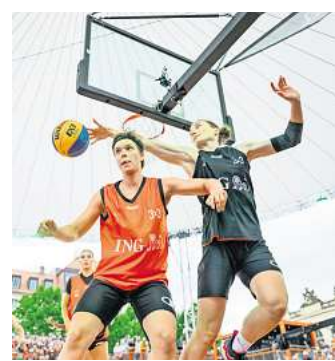
Spannende Spiele im 3x3-Basketball soll es wie hier in Dresden im nächsten Jahr auch in Hannover geben.

Speziell für diese Aufgabe ist nach Auskunft von Stadt und Region eine dreiteilige Ausbildung vorgesehen. Unterstützt