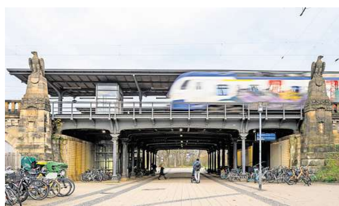
Für ein Jahr außer Betrieb: Die Bahn sperrt den Bahnhof Bismarckstraße ab 2030, um alle technischen Anlagen zu erneuern

Wie lange der Ausfall des Haltepunktes letztlich dauern werde, lasse sich zum jetzigen Zeit-