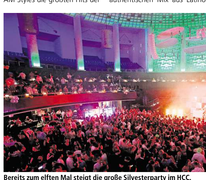
Bereits zum elften Mal steigt die große Silvesterparty im HCC.