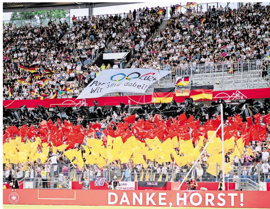
Party in Hannover vor gut 44.000 Fans: Beim letzten Frauen-Länderspiel in Hannover im Juni 2024 feierten die Fans den Abschied des damaligen Nationaltrainers Horst Hrubesch. Und ein 4:0 gegen Österreich in der EM-Qualifikation.