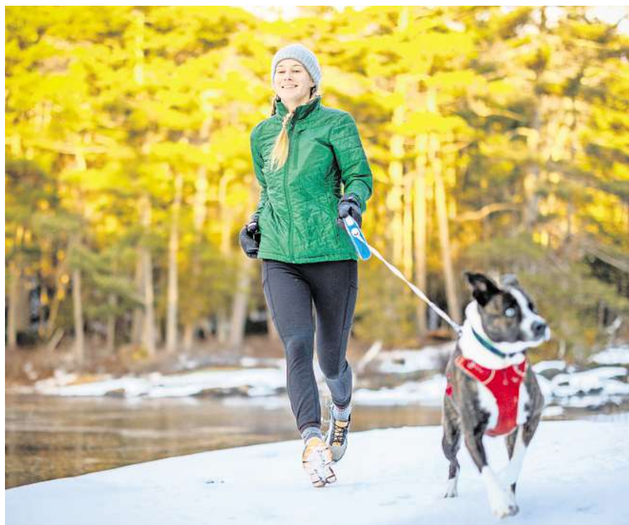
Auch bei Schnee und Eis draußen: Dieser Läuferin dürfte helfen, dass ihr Hund ohnehin vor die Tür muss.

Wenn jemand sehr schnell unterwegs ist, fährt zudem der