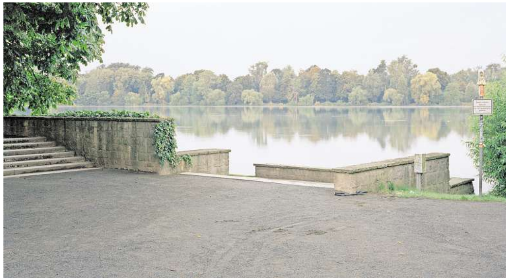
Tatort Hannover: Im Maschsee entdecken Passanten 2012 die Leiche der 44-jährigen Sexarbeiterin Andrea B.

Alle Tatorte sind unfassbar banal. Naherholungsgebiete, Straßenecken, Hauseingänge. Sonst gibt es keine Gemeinsamkeiten. Im Gegensatz zu den Opfern, die