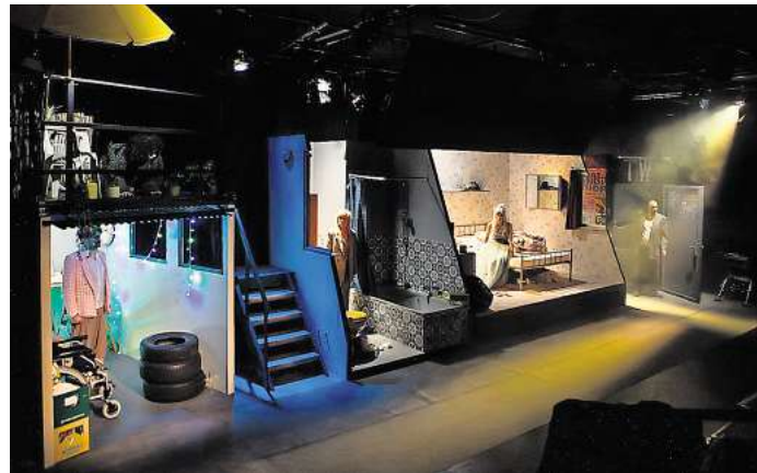
Das Theater an der Glocksee zeigt „In Schweben / In Limbo“.