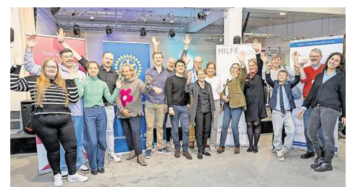
Gute Stimmung: Bei der Charity-Boutique kamen rund 12.000 Euro für den guten Zweck zusammen.

nen und Rotarier dazu bei, Gutes zu tun und gleichzeitig ein besonderes Event für die Gemeinschaft zu schaffen.