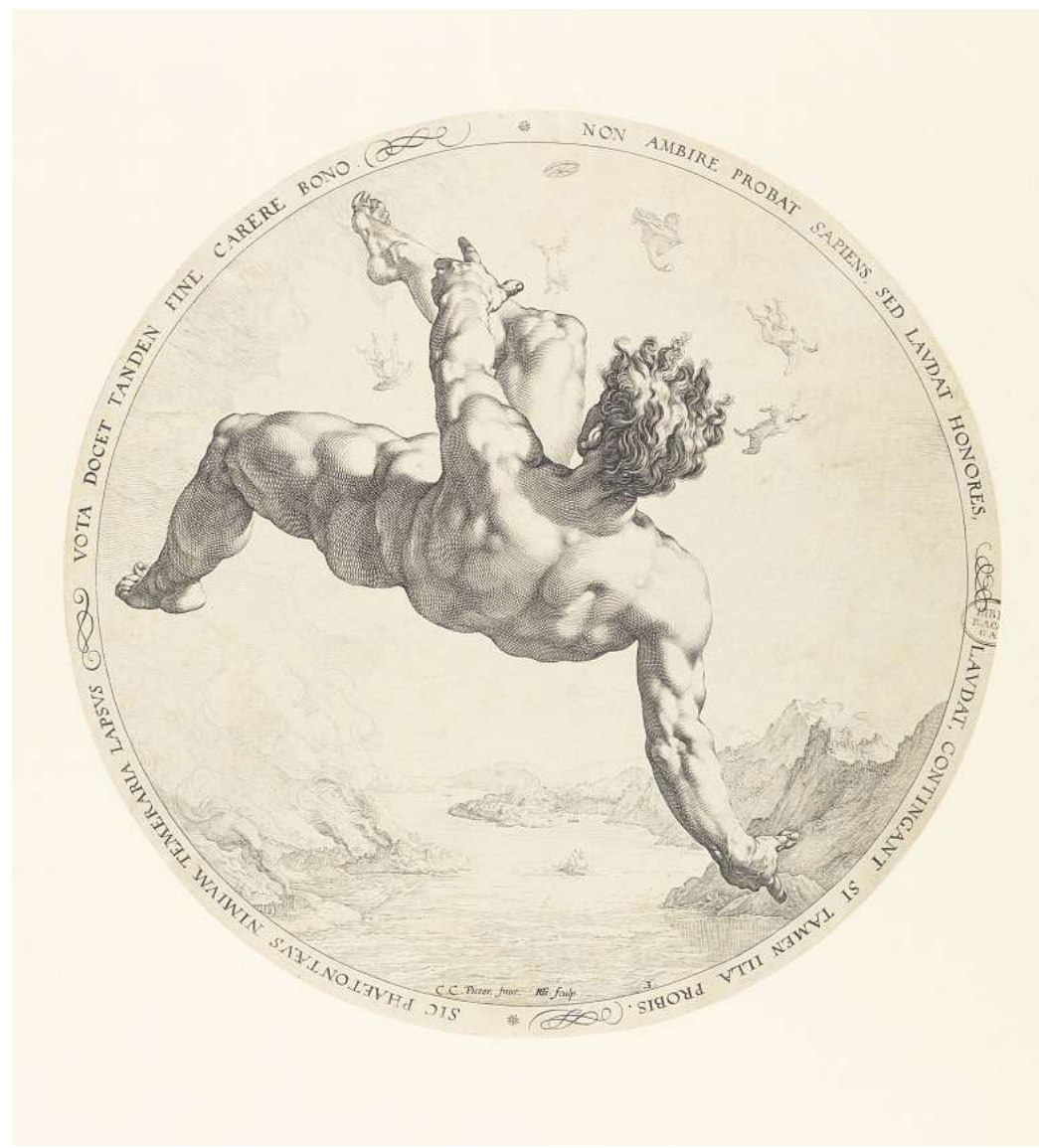
Hendrick Goltzius nach Cornelis van Haarlem, Phaeton, 1588.

Am Sonnabend, 22. November, wird ein vielfältiges Begleitprogramm angeboten, das den Blick auf die Werkprozesse und thematischen Schwerpunkte von Goltzius weiter vertieft. Von 14 bis 17 Uhr findet der Workshop „Gekonnt schraffiert“ statt, der anhand der Druckgrafiken des Künstlers in verschiedene Techniken der Schraffur einführt und zeigt, wie Linienführung und Tintenfeder den il-