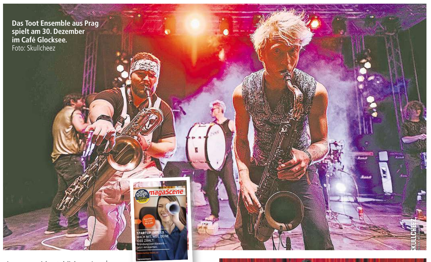
Das Toot Ensemble aus Prag spielt am 30. Dezember im Café Glocksee.

Zum krönenden Abschluss des Festivals tritt dann endlich Königliche Braut auf. In strammem Blau, mit Promille und Hackfahne, rempelt sich Königliche Braut per Bleifuß dauerhupend durch den Melodien-Traffic, um die Liebe zu preisen. Das klingt doch nach