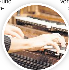
Historische Tasteninstrumente an der HMTMH.

HANNOVER. Einladung an Musikliebhaber und neugierige Entdecker historischer Klangkunst: Unter der künstlerischen Leitung von Zvi Meniker steht das „Clavierfest 2025“ der Hochschule für Musik, Theater und Medien Hannover (HMTMH) ganz im Zeichen des Cembalos – und feiert zugleich die Einweihung eines neuen Instruments nach dem historischen Vorbild von J. D. Dulcken. Die Veranstaltungen finden in Sälen der HMTMH, Neues Haus 1, statt. Der Eintritt ist frei.