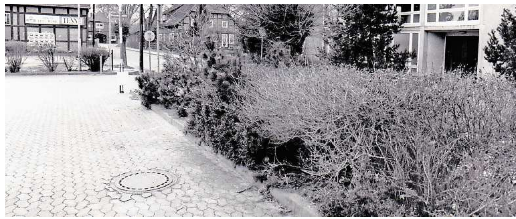
Tatort Hänigsen: Im Januar 1992 wurde hier eine 19-jährige Abiturientin nach dem Feuerwehrball vergewaltigt und erwürgt aufgefunden. In der Hecke wurde ihre Leiche gefunden.

Es war ein besonderer Abend für Hänigsen, doch der Morgen danach begann für den kleinen Ort bei Burgdorf mit einer schockierenden Nachricht. Nur wenige Meter von der Gaststätte „Zum Sachsenross“, wo noch Stunden zuvor etwa 250 Menschen den Feuerwehrball gefeiert hatten, wurde am Morgen des 19. Januar 1992 der leblose Körper einer 19-jährigen Abiturientin gefunden. Die Polizei wurde alarmiert, eilte zum Tatort, sperrte alles ab, sicherte Spuren. Schnell stand fest: Die junge Frau, die noch ihr Ballkleid trug und die so viele im Ort gemocht und geschätzt haben sollen, wurde überfallen, überwältigt, vergewaltigt und erwürgt. Doch wer konnte das getan haben? Der 6000-Seelen-Ort war geschockt – und das Misstrauen ging plötzlich um in Hänigsen und unter den Besuchern des Feuerwehrballs.