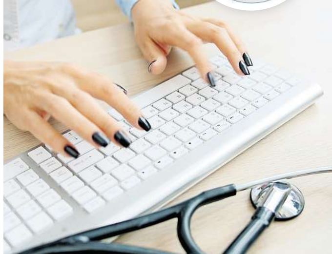
In der ePA sind sensible Gesundheitsdaten der Patientinnen und Patienten gespeichert.

Der Anteil derjenigen, die der ePA widersprochen haben, ist im Vergleich weiterhin gering. Wie der bundesweite Verband der Krankenkassen, der GKV-Spitzenverband, dem RND mitteilte, liegt die Widerspruchsquote weiterhin bei etwa fünf Prozent.