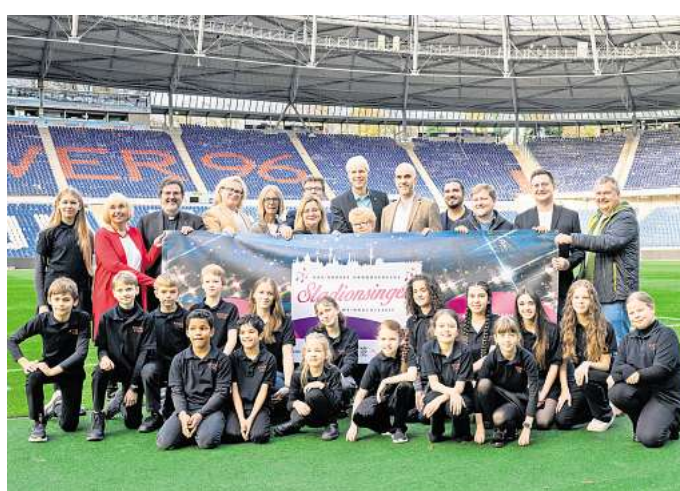
Die Veranstalter, der Kinderchor der Staatsoper sowie die Sponsoren und Unterstützer des Stadionsingens 2025 in der Heinz von Heiden Arena.