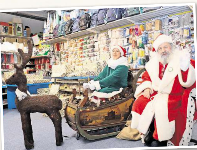
Der Weihnachtsmann will auch in diesem Jahr wieder vielen Kindern Freude bereiten...