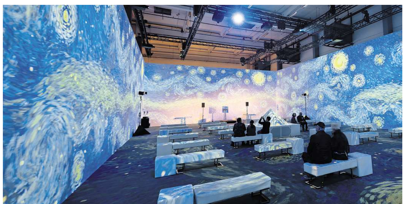
Beindruckend: Die Van Gogh Experience Ausstellung in der Alten Druckerei.

Cofo Entertainment“ heißt die Produktionsfirma, die die große Ausstellung „Van Gogh – The Immersive Experience“ durch Deutschland touren lässt. Der Firmenname sagt, worum es geht: Entertainment. Unterhaltung ist das Ziel. Und das wird erreicht. Die große Multimedia-Ausstellung, die jetzt in der Alten Druckerei neben dem Medienhaus in Hannover-Bemeroode eröffnet wurde, ist sehr unterhaltend. Man staunt. Man lacht. Man ist verblüfft. Der Einstieg ist sanft: Ein Raum mit leuchtenden Sonnenblumen, die als dreidimensionale Objekte von den Wänden hängen, begrüßt die Besucher. Dann gibt es ein paar Informationen zu Leben und Werk von Vincent van Gogh, es folgen Reproduktionen einiger seiner berühmten Gemälde und ein paar Möglichkeiten, um sich in liebevoll gemizimerten Bühnenbildern fotografieren zu lassen.