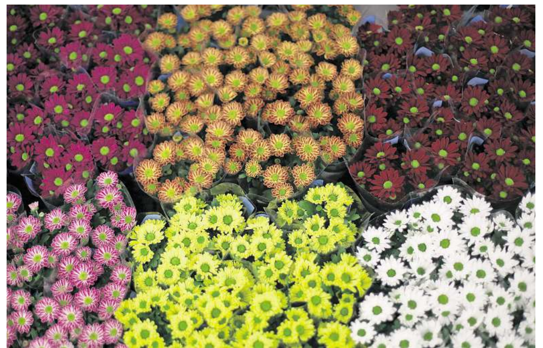
Zartes Rosa, leuchtendes Gelb, tiefes Burgunderrot: Chrysanthemen überzeugen mit Farbenpracht.

Es gibt mehr als 400 verschiedene Chrysanthemen-Sorten, jede hat ihren Charakter. Etwa mit kleinen Mini Blüten, Santinis genannt, oder als Spider-Chrysanthemen mit ihren auffällig gefin-