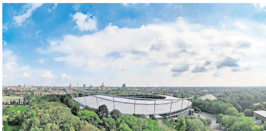
Möglicher Austragungsort: Olympische Fußballspiele könnten im Stadion am Maschsee stattfinden.