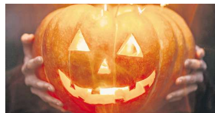
Grusel Spaß zu Halloween

„Dem Schauer den Schrecken nehmen“ heißt am 30. bis 31. Oktober im Erlebnis-Zoo Hannover eine schaurig-schöne Halloween-Tour. Was ist dran an der Mär vom bösen Wolf? Sind die Tiere, die bei uns eine Gänsehaut auslösen, wirklich so schrecklich oder doch vielleicht nur schaurig schön? Die Zoo-Führer werden den Schrecken entzaubern und mit den Gästen in das Reich der Dämmerung eintauchen. Es bleibt eine Überraschung, welche tierischen Hauptakteure auf dieser Halloween-Tour warten. Die Führung richtet sich an Erwachsene sowie an von diesen begleitete Kinder ab sieben Jahren. Eine Reservierung ist online erforderlich auf zoo-hannover.de/event-kalender , die Teilnahme kostet 24 Euro, ermäßigt 19 Euro. RED