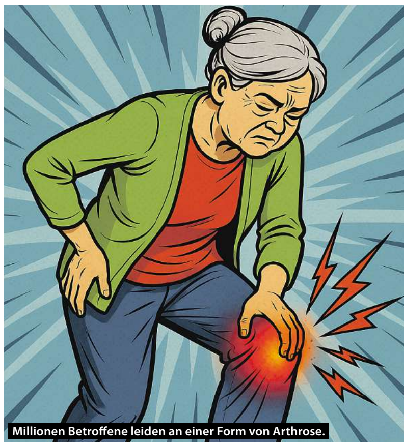
Millionen Betroffene leiden an einer Form von Arthrose.

Arthrose in den Fingern befällt in der Regel