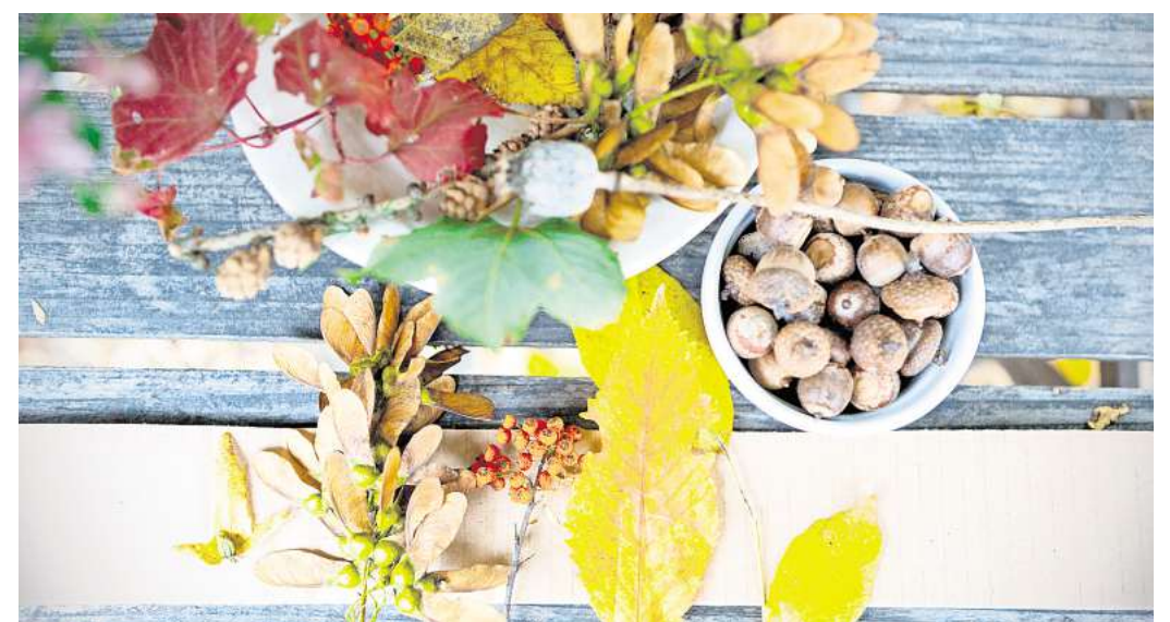
Für kleine Kinder, große Kinder und Erwachsene – mit Blättern kann jeder tolle Sachen basteln.

Für welche Bastelei Sie sich auch entscheiden: Überlegen Sie, ob trockene, gepresste Blätter besser geeignet sind oder frische, und treffen Sie entsprechende Vorbereitungen. Wenn Blätter aufgeklebt werden sollen, ist es meist von Vorteil, wenn sie schön flach gepresst sind. Denn spätestens beim Trocknen würden sich die Blätter kräuseln. Aber Vorsicht: Die Blätter sind nach dem Pressen sehr dünn und empfindlich.