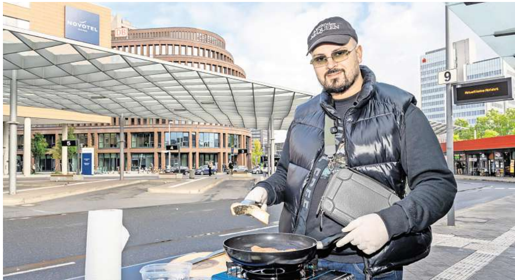
„Asphalt Kitchen“ sieht im Kochen auf der Straße eine Chance für soziale Arbeit: „Statt Jungs, die nichts mit sich anzufangen wissen, von Spielplätzen zu verschrecken, sollte man ihnen lieber etwas bieten“, sagt er.

Erst Anfang des Jahres entdeckte „Asphalt Kitchen“ das Kochen für sich. Früher lebte er von Fertiggerichten und hatte