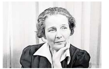
Eine Künstlerin wird wiederentdeckt: Käthe Steinitz.

HANNOVER. Das Sprengel Museum Hannover widmet der Künstlerin, Autorin und Kunstwissenschaftlerin Käthe Steinitz (1889–1975) erstmals eine umfassende Retrospektive. Unter dem Titel „Käthe Steinitz. Von Hannover nach Los Angeles“ werden bis zum 25. Januar 2026 rund 180 Werke aus sieben Jahrzehnten gezeigt – darunter expressionistische Hinterglasbilder, Zeichnungen, Fotografien und Texte, die den Lebensweg der Künstlerin und ihr Schaffen und Wirken nachzeichnen. Erstmals werden zahlreiche fotografische Arbeiten präsentiert, die bislang nur als Negative überliefert waren. Begleitend zur Ausstellung erscheint im Hirmer Verlag eine Monografie. Sie ist Ergebnis eines Forschungsprojekts, das vom Niedersächsischen Ministerium für Wissenschaft und Kultur gefördert wird. Zudem vergibt die Landeshauptstadt Hannover erstmals den „Käthe Steinitz Preis für künstlerische Kollaboration“, der das vielseitige Schaffen der Künstlerin in die Gegenwart führt.