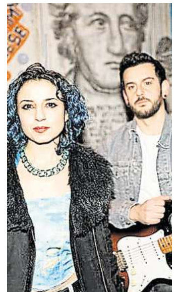
Live: Perish to the Muse aus Hannover.

HANNOVER. Die hannoversche Newcomer-Band Perish to the Muse ist am Mittwoch, 29. Oktober, im Rahmen der „Songwriter Nights“ live im Kulturpalast, Deisterstraße 24. Mit ihrer Debüt-Single „Home“, die sie im Februar 2025 veröffentlicht hat, erschafft die Band Klangräume zwischen Soul und Funk, in denen man sich verlieren – oder vielleicht sogar wiederfinden – kann. Getragen von Gitarrensounds und einer Stimme, die jeden Raum neu färbt, erzählen die Musiker Geschichten mit emotionaler Tiefe – Songs über Liebe, Verlust und Verletzungen, über Spiritualität, Glauben und Existenz oder die Frage nach dem, was zwischen den Dingen liegt. Das Konzert beginnt um 20 Uhr, anschließend ist Open-Mic-Session. Der Eintritt ist frei. RED