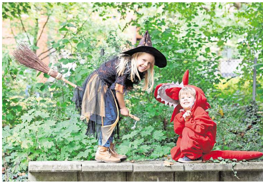
Liegen im Trend: Kostüme für kleine Hexen mit Zauberhut und Besen.

Doch nicht nur die Kinder feiern, auch unter den Erwachse-