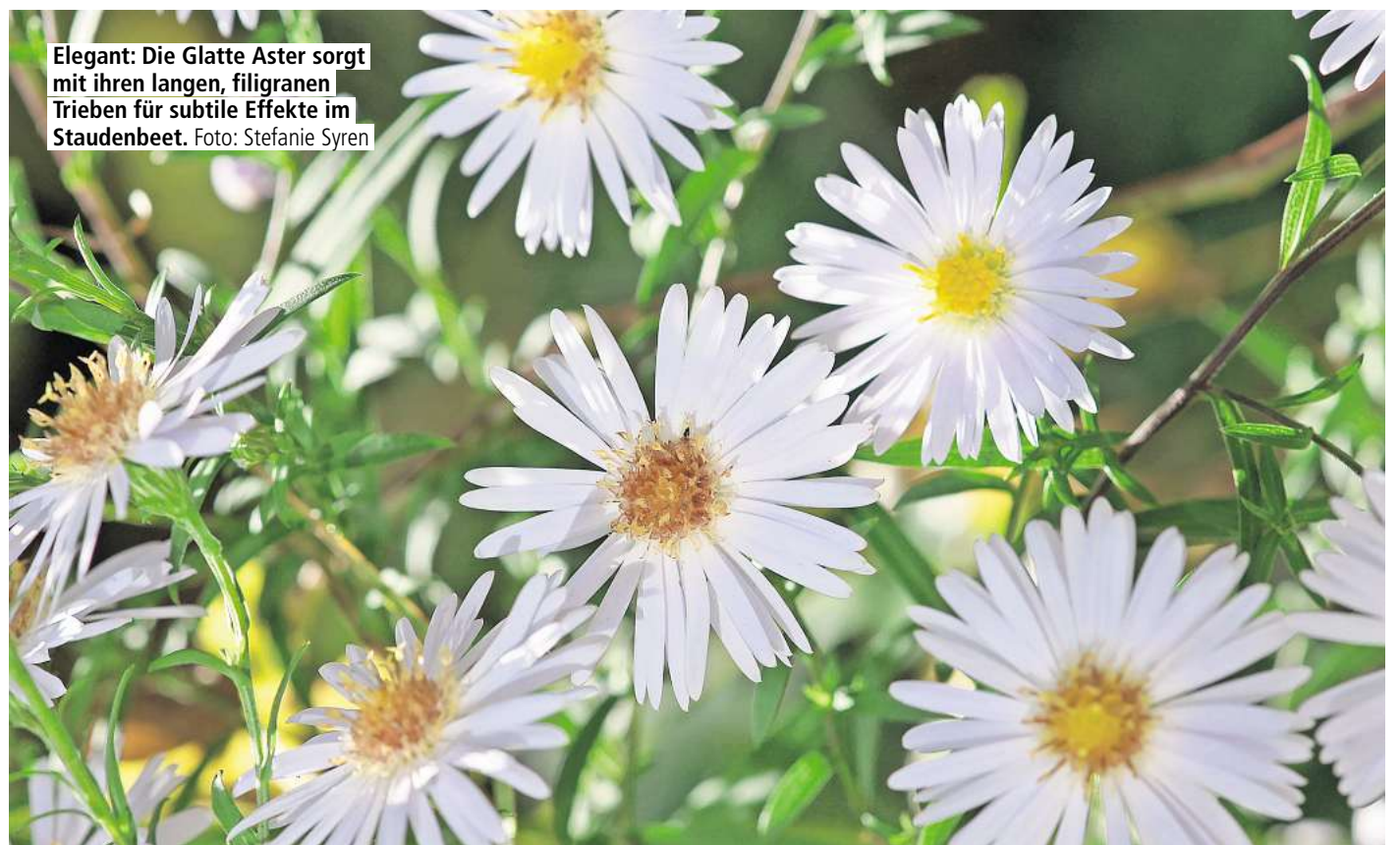
Elegant: Die Glatte Aster sorgt mit ihren langen, filigranen Trieben für subtile Effekte im Staudenbeet.

Volle Sonne lässt die Blüten leuchten und ist für die meisten