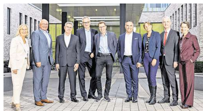
Gemeinsam für Spitzenmedizin: MHH und KRH therapieren und erforschen künftig gemeinsam Lungenkrankungen.

Ein Spitzenzentrum für Lungen- und Thoraxmedizin in Hannover – das ist daher das gemeinsame Ziel der Medizinischen Hochschule Hannover (MHH) und des Klinikums Region Hannover (KRH). Das Hannover Lungen und Thorax Centrum (HLTC), dessen Start für 2026 vorgesehen ist, soll eines der größten und leistungsfähigsten dieser Art in Deutschland werden. Die gemeinsame Leitung und die Einrichtung einer Schwerpunktprofessur an der MHH sind Eckpfeiler des Vorhabens.