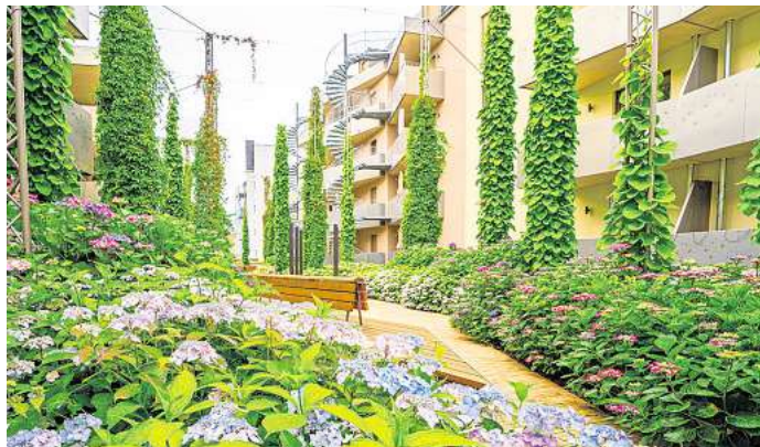
Blumenpracht für das Klima: Die Hortensien im Hof an der Nikolaistraße blühen im Sommer, an vertikalen Gerüsten klettern Wein und Pfeifenwinde nach oben.

In einigen Jahren dürfen sich die Anwohnenden dann aber