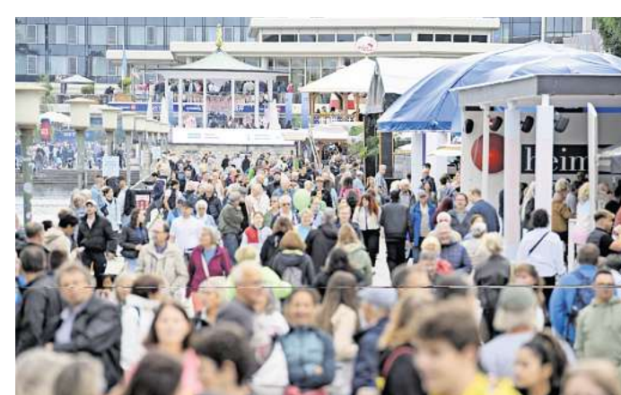
Überschneidung in 2026: Das Maschseefest (Foto oben) und die Finals laufen zeitgleich in Hannover.

Bei der Ausrichtung des Kirchentages im Frühjahr 2025 und bei der großen Feier zum Tag der Deutschen Einheit im Jahr 2014 habe Hannover bereits bewiesen, dass Großveranstaltungen in der Stadt gut funktionieren. „Das ist geübt, das werden wir wieder hinbekommen“, ist sich der Oberbürgermeister sicher. Auf dem Maschsee sind aktuell Kanupolo, Kanusprint und Rudern geplant. Weitere Finals-Wettkämpfe sollen in unmittelbarer Nähe ausgetragen werden. Rund um das Neue Rathaus etwa soll es 3x3-Basketball, Breakdance und BMX-Wettkämpfe geben. Im ebenfalls nur wenige Fußminuten vom