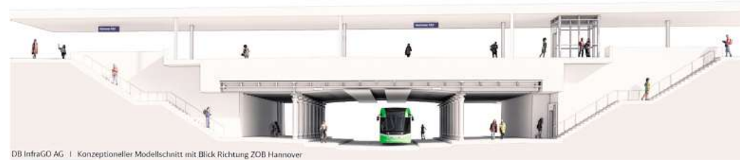
DB InfraGO AG | Konzeptioneller Modellchnitt mit Blick Richtung ZOB Hannover

Und wem ist zu verdanken? Nach Darstellung von Bund und Bahn ist die jetzt gefundene Lösung ganz unspektakulär das Ergebnis der Abwägung vorgeplanter Varianten nach Kriterien,