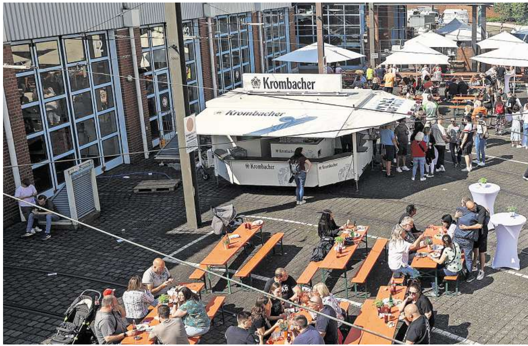
Auf dem Glocksee-Gelände am Ira-Wolkowa-Weg geht's am 21. September um Busse, Stadtbahnen und jede Menge Spaß.

So feiert der Bereich Bus das Jubiläum „100 Jahre Kraftomnibus“ und präsentiert dabei historische Fahrzeuge – vom frühen Pferdebus aus dem Jahr 1895 bis zu modernen Modellen. Auch die Stadtbahn steht im Mittelpunkt: Zum 50. Geburtstag sind sämtliche Fahrzeugtypen zu sehen, darunter auch der seltene Prototyp 601.