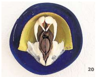
Arbeiten von Dieter Rammilmair werden in der Ausstellung „Zero Waste“ gezeigt. Foto: Dieter Rammilmair

➤ Nähere Informationen zur Ausstellung und den beteiligten Kunstschaffenden stehen online: 4h-art.de