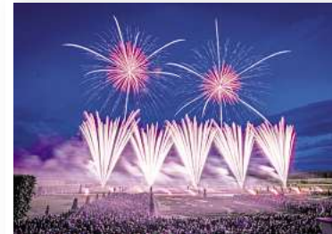
Feuerspektakel über den Herrenhäuser Gärten.

nen wie aus Gladiator, Rocky oder Star Wars an den Himmel über Herrenhausen – eindrucksvoll inszeniert mit Licht, Musik und Originalstimmen berühmter Sprecher. Auch an diesem spätsommerlichen Abend erwartet die Gäste ein abwechslungsreiches Begleitprogramm. Im Gartentheater lädt die Tribut-Band „ReCartney“ zu einer musikalischen Reise durch das Universum der Beatles ein. „Me & Ms. Jacobs“ begeistert auf der Probephase mit Eclectic Soul und Vintage Vibes und auf der Kleinkunsthöhe stimmt ein akrobatischer Feuer-tanz auf das Feuerwerk um 21