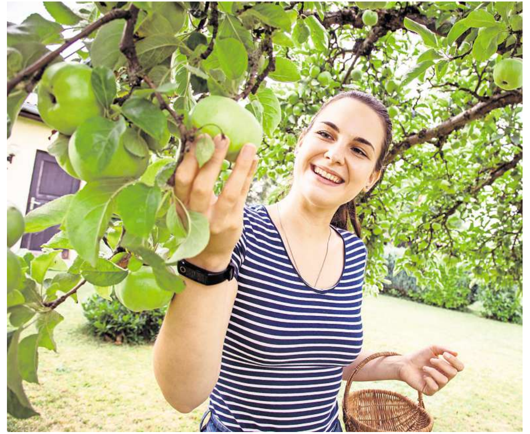
Weder pralle Sonne noch Regen: Das Wetter spielt bei der Ernte von Äpfeln eine wichtige Rolle.

Anhand der Färbung der Schale oder der Kerne lässt sich nur bedingt ablesen, ob Äpfel wirklich reif sind. Stattdessen kann man es mit der sogenannten Kipp-Probier herausfinden. Und so funktioniert es: den Apfel am Zweig um bis zu 90 Grad nach oben biegen. Wenn sich die Frucht mitsamt Stiel einfach vom Zweig löst, ist sie reif und darf den Baum verlassen. Bleibt