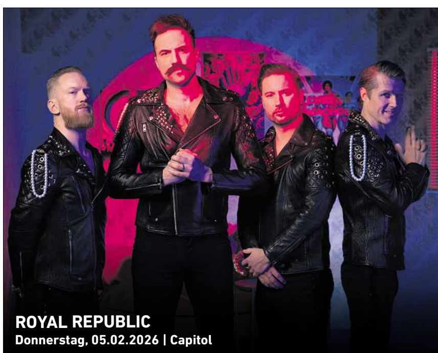
ROYAL REPUBLIC Donnerstag, 05.02.2026 | Capitol